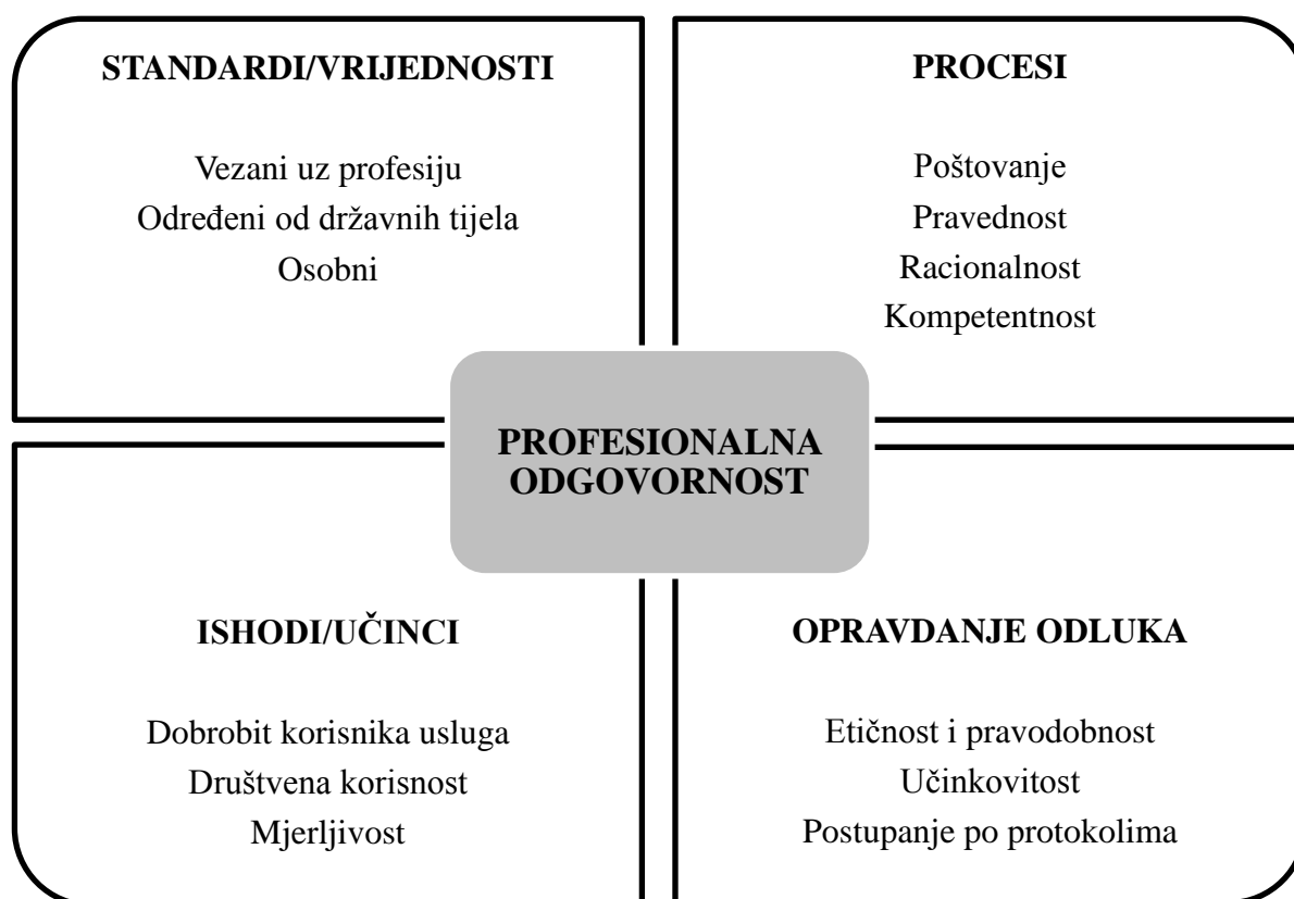
Slika 1. Prikaz odrednica profesionalne odgovornosti (prema Ajduković, 2013).

Određenje toga što je primjereno, etički ispravno i obavezno u terminima profesionalne odgovornosti ovisi o nacionalnim politikama, zakonima, tipu socijalnog zbrinjavanja, kulturi, ulozi i obilježjima pomagačke profesije, te vrsti posla i samom korisniku (Ajduković, 2013). Profesionalno djelovanje predstavlja samo ono djelovanje koje je usmjereno prema nekom osobno i društveno prihvatljivom cilju (Etički kodeks socijalnih pedagoga, 2005).