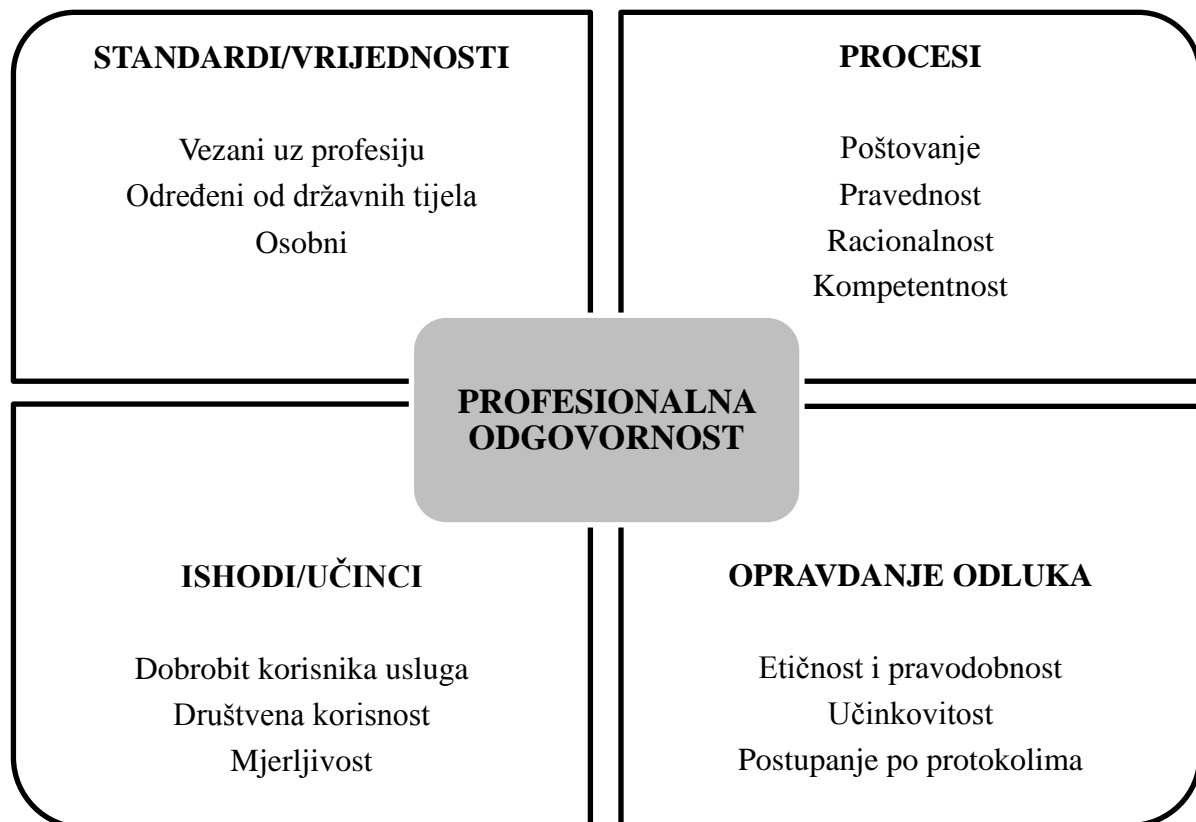
Slika 1. Prikaz odrednica profesionalne odgovornosti (prema Ajduković, 2013).

Određenje toga što je primjereno, etički ispravno i obavezno u terminima profesionalne odgovornosti ovisi o nacionalnim politikama, zakonima, tipu socijalnog zbrinjavanja, kulturi, ulozi i obilježjima pomagačke profesije, te vrsti posla i samom korisniku (Ajduković, 2013). Profesionalno djelovanje predstavlja samo ono djelovanje koje je usmjereno prema nekom osobno i društveno prihvatljivom cilju (Etički kodeks socijalnih pedagoga, 2005).