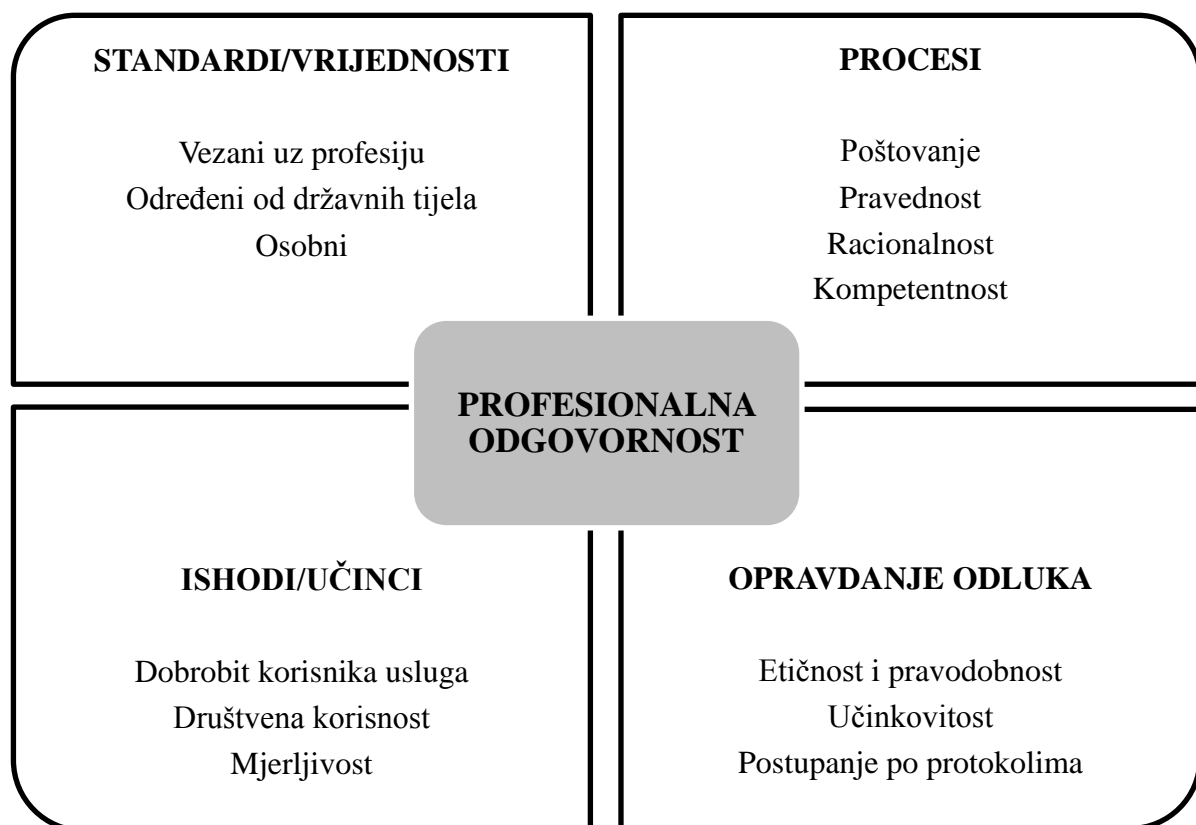
Slika 1. Prikaz odrednica profesionalne odgovornosti (prema Ajduković, 2013).

Određenje toga što je primjereno, etički ispravno i obavezno u terminima profesionalne odgovornosti ovisi o nacionalnim politikama, zakonima, tipu socijalnog zbrinjavanja, kulturi, ulozi i obilježjima pomagačke profesije, te vrsti posla i samom korisniku (Ajduković, 2013). Profesionalno djelovanje predstavlja samo ono djelovanje koje je usmjereno prema nekom osobno i društveno prihvatljivom cilju (Etički kodeks socijalnih pedagoga, 2005).