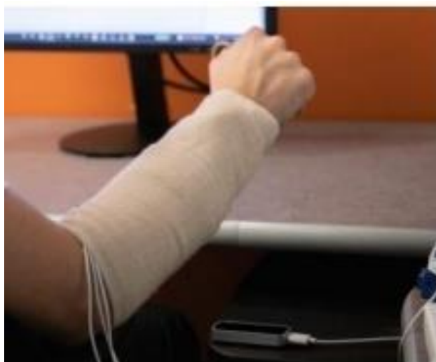
Slika 3 LMC kontrolor (Goriux i sur., 2022)

LMC je USB uređaj prikazan na slici broj 3, koji ima tri infracrvena LED svjetla i dvije infracrvene kamere koje prate položaj gornjih udova i omogućuju pomicanje pokazivača na zaslonu pokretima gornjih udova (Bachmann, i sur., 2015 prema Giroux i sur., 2022). Ovaj uređaj se intenzivno koristi u rehabilitacijskoj terapiji za pacijente koji su preboljeli moždani udar i imaju motoričke teškoće gornjih ekstremiteta (Giroux, 2022). Do sada nije napravljeno istraživanje o potencijalima ovog uređaja kao alternativni mišu. Upotrebljivost uređaja kao što su miš, joystick ili LMC uređaj procjenjuje se pomoću standardiziranog multidimenzionalnog upitnika ISO-9241-9 pomoću jednodimenzionalnih i dvodimenzionalnih Fitts zadataka. Ovi zadaci sastoje se od pomicanja pokazivača što preciznije i brže od jedne fiksne točke do druge. Dok su Fittsovi zadaci procjenjivali brzinu i točnost postizanja pokreta treći zadatak praćenja spirale bio je procjena fine motorike s pokazivačem (Giroux i sur., 2022).