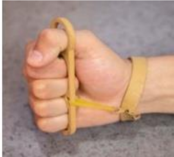
Slika 2 Simulacijska udlaga dizajnirana od 3D isprintanih plastičnih i gumenih traka (Gorux i sur., 2022)

U drugoj studiji izabrano je pet sudionika koji su preživjeli moždani udar, putem online platforme u Velikoj Britaniji, “My stroke guide“ ( https://www.stroke.org.uk/ prema Giroux i sur., 2022) 37. Different Strokes ( https://differentstrokes.co.uk/i prema Giroux i sur., 2022) i iz baze podataka sudionika prethodnog istraživanja u Wellcome Centre for Integrative Neuroimaging i testiran je neoptimalni miš.