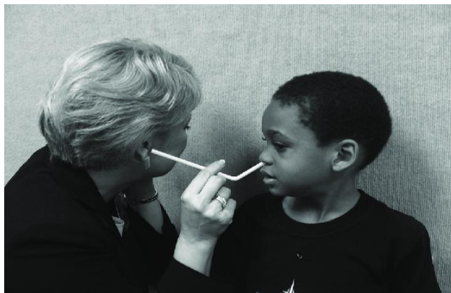
Slika 3: Prikaz uporabe slamke (Preuzeto od Kummer, 2014)

Prema ASHI (2017), u skupinu visokotehnoloških sredstava, za koje postoje znanstveni dokazi o terapijskoj primjeni, spadaju elektropalatografija i nazofaringoskopija. Iako nije klasificiran u navedenim podjelama, potrebno je izdvojiti još jedno terapijsko sredstvo za koje se pokazalo da ima značajan učinak - Ballovent set. Obzirom da se set sastoji od balona, ventila i plastičnih uzica, može se zaključiti da pripada skupini niskotehnoloških sredstava.