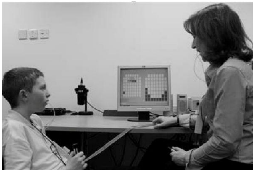
Slika 4: Prikaz terapije elektropalatografom (preuzeto od Gibbon i sur., 2013)

vizualni prikaz kako bi naučili svoje pacijente uspostaviti novi, odgovarajući artikulacijski obrazac (Schmidt, 2007).