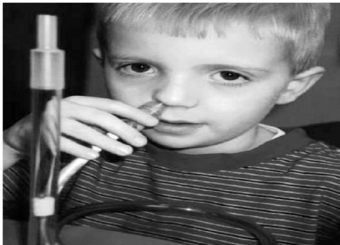
Slika 2: Upotreba See-scapea u ispitivanju nazalne emisije zraka (Preuzeto od Kummer, 2007)

Iako See-scape pruža više informacija o pritisku zračne struje nego o samoj nazalnosti, može uputiti na nedostatnu velofaringealnu pregradu, što se očituje kao hipernazalnost. See-scape se ne primjenjuje samo u dijagnostičke svrhe, već i u rehabilitacijske. U terapijskim radu koristi se kao vizualni feedback koji pomaže djeci u kontroliranju nazalne emisije zraka (Blaži, Turkalj, Dembitz, 2010).