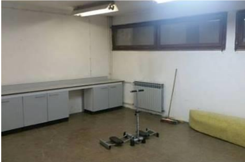
Slika 2. Teretana Doma za odgoj djece i mladeži Zagreb prije obnove