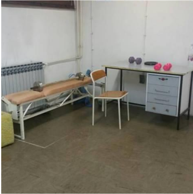
Slika 1. Teretana Doma za odgoj djece i mladeži Zagreb prije obnove