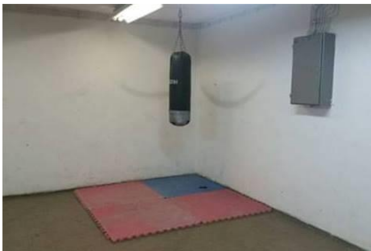
Slika 3. Teretana Doma za odgoj djece i mladeži Zagreb prije obnove

Ova je akcija prikupljanja donacija za teretanu u Domu poprimila i širu zastupljenost u medijima. Tako je Hrvatska radiotelevizija emitirala i objavila na svojim mrežnim stranicama dva priloga o akciji pod nazivima „Pomozite djeci u Dugavama da ostvare veliku želju i opreme teretanu“ 5 i „Teretana, najveća želja štićenika doma u Dugavama“ 6 (www.hrt.hr). Isječak iz ovih televizijskih priloga sniman je u Domu za odgoj djece i mladeži u Zagrebu u svibnju kada je i emitiran, dok je u sklopu navedenih priloga na mrežnim stranicama HRT-a objavljen u lipnju i srpnju (24. lipnja i 6. srpnja 2016). O cjelokupnoj je volonterskoj akciji i Volonterskom klubu pisano i na internetskom portalu srednja.hr 7 , uz poziv čitateljima da se u skladu s željom i mogućnostima pridruže akciji i doniraju potrebno (www.srednja.hr). Prikazi medijskih članaka o ovoj volonterskoj akciji nalazi se u Prilozima.