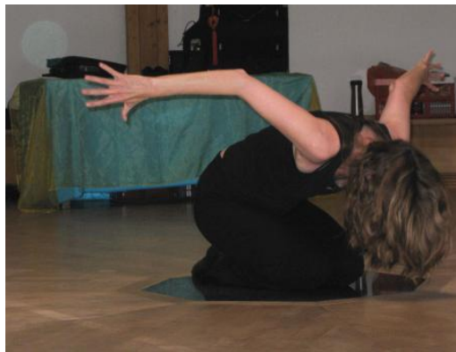
Slika 6. Izvorni pokret

Kao jedna od srodnih formi koja se može koristiti uz terapiju pokretom i plesom je kontakt improvizacija u kojoj je kontakt između plesača polazišna točka koja vodi prema stvaranju jedinstvenog improviziranog pokreta i/ili plesa (Lemieux, 1988). Improvizirani pokret se razvija na osnovi unutarnje svijesti o vlastitom tijelu, te svijesti o odnosu kretanja s