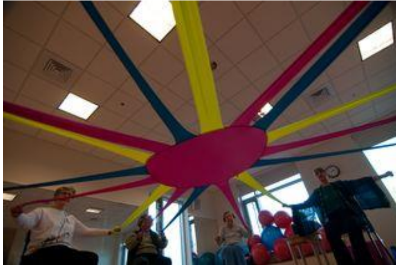
Slika 13. Prikaz aktivnosti rastezanje marame ( http://www.savez-spuh.hr/vijesti/ppp/ )

Kraj čini završni čin kod seanse. Nakon relaksacije kada su prethodno sudionici uvedeni u svoj privatni svijet, ponovo se u završnom činu postiže zajedništvo i stvara zajednička energija kroz aktivnosti (slika 14) kao što su grupni zagrljaj, grupni naklon, rastezanje, skok i pohvala voditelja upućena sudionicima seanse (Dunphy, Scott, 2003).