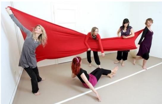
Slika 4. Primjena rekvizita u terapiji

Ilustracija pojedinih tehnika prikazana je na slikama ( 4, 5, 6):