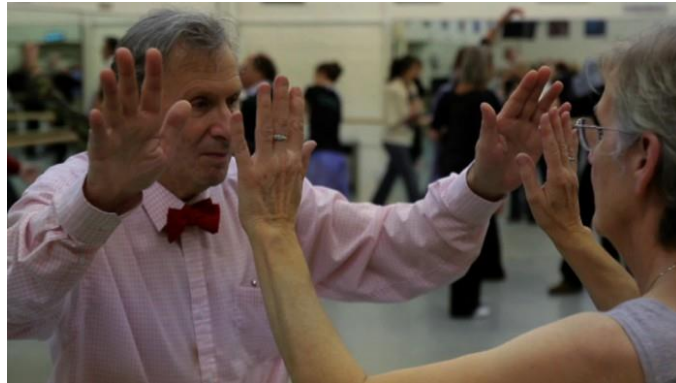
Slika 10. Prikaz aktivnosti zrcaljenja ( http://balletnews.co.uk/ballet-and-parkinsons/ )

sudionci ostvare kontakt tijelom s partnerom, te se usklađuju s partnerom. Guranje, povlačenje i topljenje isto tako može biti aktivnost u kojoj sudionik ostvaruje kontakt tijelom s drugim sudionikom (slika 11), nadalje ostvaruje povjerenje, razvija snagu i kontrolu, te izvodi pokret tijela vertikalno i horizontalno. Jedna od aktivnosti koja je moguća je izvođenje skulpture tijelom ili grupna skulptura, gdje je fokus na razvijanje suradnje među sudionicima, individualnog donošenja odluke i oblikovanje tijela u određeni oblik.