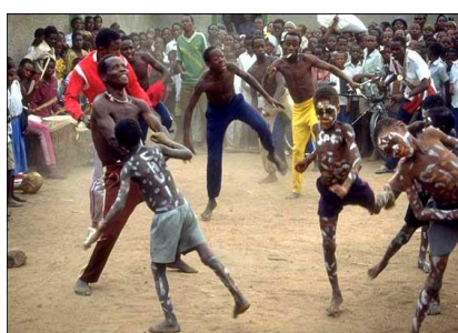
Slika 2. Prikaz plesne ceremonije