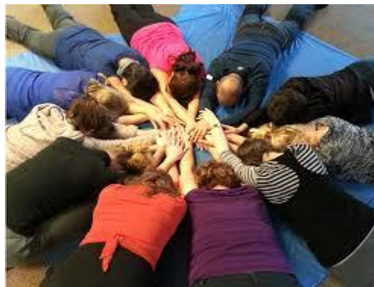
Slika. 14. Prikaz grupnog zagrljaja ( http://www.westcoastdmt.com/ )

Kraj čini završni čin kod seanse. Nakon relaksacije kada su prethodno sudionici uvedeni u svoj privatni svijet, ponovo se u završnom činu postiže zajedništvo i stvara zajednička energija kroz aktivnosti (slika 14) kao što su grupni zagrljaj, grupni naklon, rastezanje, skok i pohvala voditelja upućena sudionicima seanse (Dunphy, Scott, 2003).