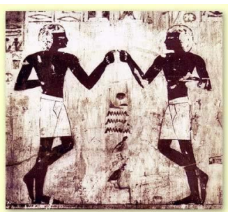
Slika 1. Prikaz plesne figure u Egiptu

Obredna i simbolička primjena plesa korištena je već u prapočetku ljudske civilizacije, tijekom različitih povijesnih razdoblja, pa sve do današnjih dana u okviru vjerskih, iscjeliteljskih i socijalnih ceremonija (slika 1, 2, 3). Arheološki nalazi tragova plesa prisutni su na zidnim freskama od prapovijesnog vremena kao npr. kod 9,000 godina stare Bhimbetske špilje u Indiji i Egipatskog groba, gdje je na slici prikazana plesna figura od 3300. godina prije Krista. Jordania (2011) smatra da je ples, zajedno s ritmom glazbe i oslikavanjem tijela nastao kao snaga prirodne selekcije u ranoj fazi hominoidne evolucije kao potencijalni alat za grupiranje ljudskih predaka u borbenom zanosu i transu. S druge strane, ples je bio upotrebljen kao dio obrednog ili ritualnog liječenja, i još uvijek se koristi u tu svrhu u nekim kulturama iz brazilske prašume do Kalahari pustinje (Guenther, 1975). Ples je također odigrao važnu ulogu u prošlosti davajući ratniku moralnu podršku (Pieslak, 2009), također u pričanju mitova, te je utjecao na odnos između ljudi ili bogova (Comte, 2004).