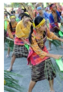
Slika 3. Prikaz plesne ceremonije