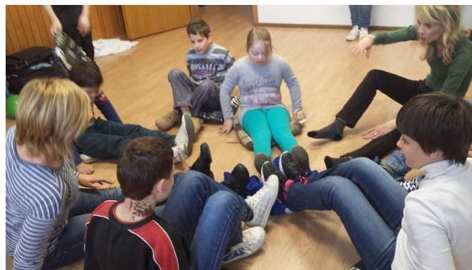
Slika 11. Prikaz aktivnosti guranja, topljenja i povlačenja

Improvizacija i solo , omogućuje sudionicima da slobodno odaberu omiljenu glazbu ili voditelj grupe odabire glazbu koja je poticajna za pravljenje pokreta marširanja, skakanja i stajanja, pogotovo je primjenjivo kod djece koja hodaju na prstima, stoga te aktivnosti mogu imati veliki učinak na poboljšanje hoda. Isto tako često se koriste afrički bubnjevi koji potiču doživljaj ritma i time snažnijeg pokreta. U improvizaciji se mogu koristiti i različiti pribori i