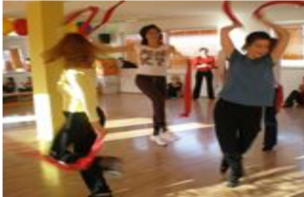
Slika 12. Prikaz improvizacije uz pomoć pribora

materijali (slika 12) kao maske, baloni, bubnjevi i itd . Glavni fokus kod improvizacije jest razvoj kreativnost, samopoštovanje, pravo na izbor i razvoj osobnog stila. Kao što je navedeno, ono nije usmjereno prema terapijskom učinku, ali može biti.