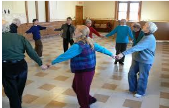
Slika 9. Prikaz uvodnog zagrijavanja kroz jednostavan krug hodanja

sudionicima, uvodna pjesma, igra stolicom, šetnja svakog sudionika unutar kruga, igra u parovima, korištenje glazbe i određene pjesme, izvođenje vlastitog pokreta koji se imitira od ostalih članova grupa itd., (slika 9).