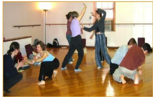
Slika 5. Mirroring