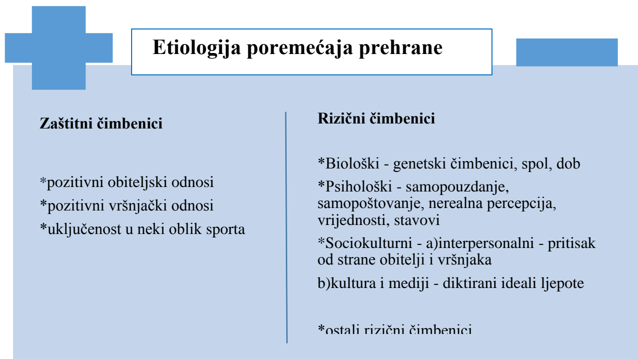
Slika 2. Etiologija poremećaja prehrane

d) Sociokulturnološki model – obilježeno kulturnim standardima.