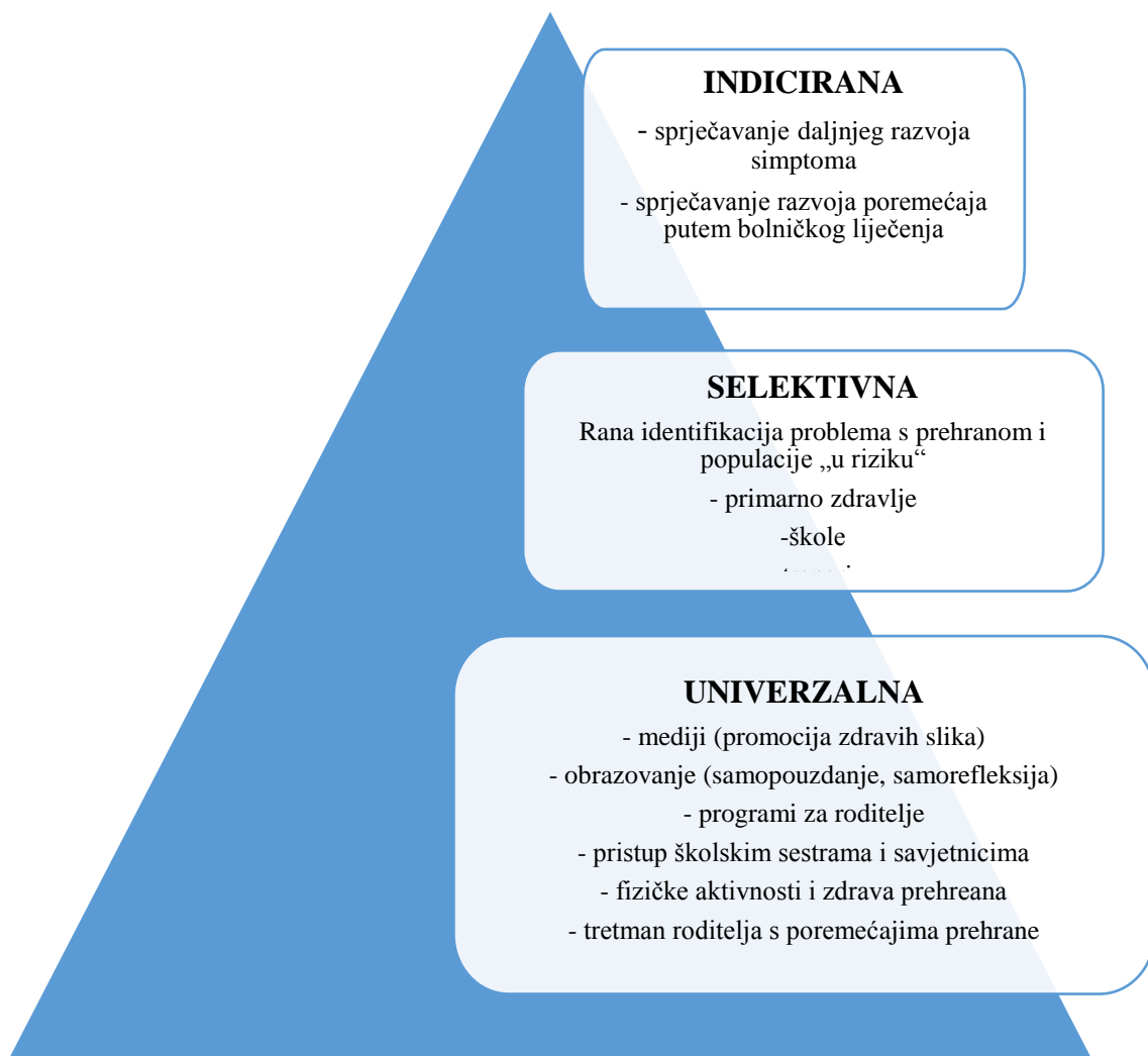
Slika 3. Model prevencije (Dwivedija i Harper, 2004; adaptirano prema Bašić, 2009)

Na indiciranoj razini su u fokusu oni kod kojih su detektirani simptomi poremećaja prehrane te je glavni cilj utjecaj na te simptome i što ranija intervencija 3 . Na indiciranoj razini nije nužno djelovati na simptome i/ili čimbenike rizika poremećaja prehrane, nego i na daljni razvoj poremećaja i njegovu gradaciju. Nadalje, biti će prikazan modificiran model prevencije Dwivedija i Harpera (2004):