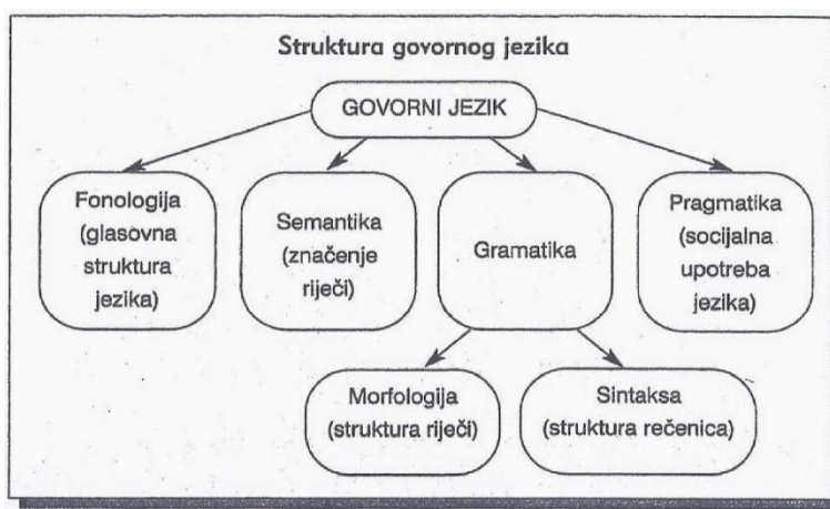
Slika 1: Struktura govornog jezika (Likierman i Muter, 2007)