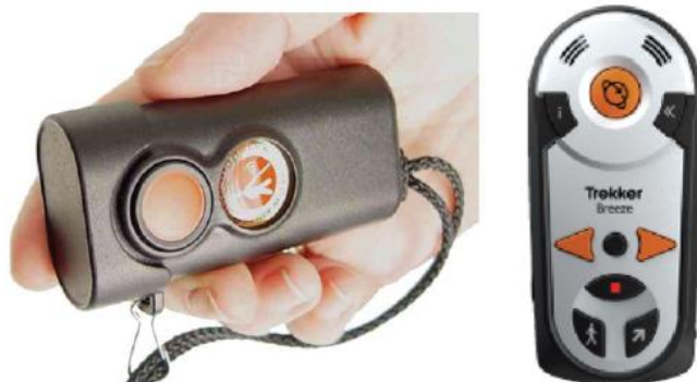
Slika 6: Miniguide (lijevo) i Breeze (desno) [GDP Research prema Vincent, 2004]

Prednosti uređaja koje su izdvojili sudionici u istraživanju su osjećaj sigurnosti jer raspon detekcije veći od bijelog štapa, jednostavni su za postavljanje i korištenje. Nedostaci su što može biti teško koristiti i bijeli štاپ i uređaje istovremeno (nemaju slobodnu ruku), teško je koristiti je za vrijeme zime (hladnoća i korištenje rukavica), osjetljiv je u napućenim prostorima tj. vibrira previše (Miniguide), mora biti paralelan za površinom (Miniguide), GPS ne funkcionira uvijek (Breeze).