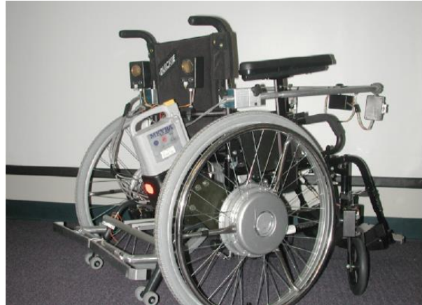
Slika 7: The Smart Power Assistance Module - SPAM (Sampson, 2005)

Oštećenje vida može utjecati na sposobnost osobe da upravlja kolicima na razne načine. Najveći je problem uočavanje prepreka i orijentira. Isto tako, može otežati izvršenje zadataka koji zahtijevaju koordinaciju oko-ruka kao što je prolaz kroz uzak prolaz ili pozicioniranje za stol (Simpson i sur., 2008).