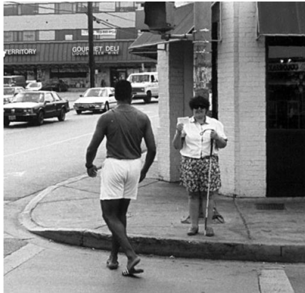
Slika 4: Položaj gluhoslijepa osobe dok traži pomoć za prelazak ulice (Sauerburger i Jones, 1997)

Isti autori navode da je i način na koji osoba stoji i drži karticu gotovo jednako važan kao i njezin sadržaj. Osoba mora stajati tako da jasno sugerira kako želi prijeći ulicu (uz sam rubnik okrenut u smjeru pješačkog prijelaza) dok drži karticu ( Slika 4 ). Kartica treba biti blizu ramena, odmaknuta na stranu kako prolaznici ne bi pomislili da osoba čita s kartice.