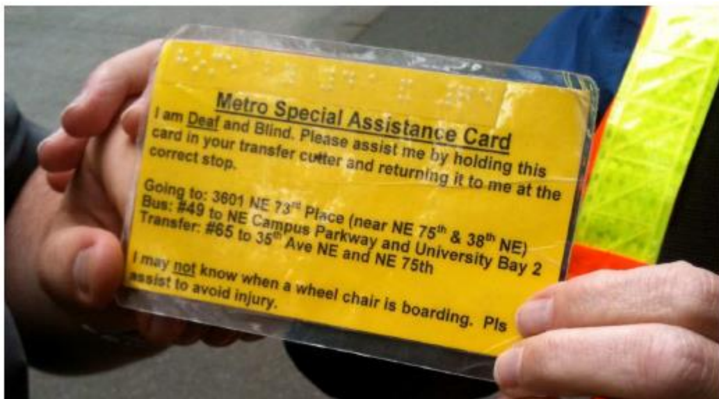
Slika 5: Kartica koji drži gluhoslijepa osoba za komunikaciju s vozačem autobusa (Azenkot, 2011).

Bourquin i Sauerburger (2005) navode važnost dobre pripreme, posebno kada osoba zna da će koristiti javni prijevoz. Priprema uključuje informacije o broju i voznom redu autobusa/tramvaja te kartice, snimljene poruke, skice odredišta i sl. koje će biti potrebne za komunikaciju s vozačima ( Slika 5 ) i prolaznicima.