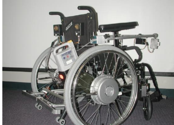
Slika 7: The Smart Power Assistance Module - SPAM (Sampson, 2005)

Oštećenje vida može utjecati na sposobnost osobe da upravlja kolicima na razne načine. Najveći je problem uočavanje prepreka i orijentira. Isto tako, može otežati izvršenje zadataka koji zahtijevaju koordinaciju oko-ruka kao što je prolaz kroz uzak prolaz ili pozicioniranje za stol (Simpson i sur., 2008).