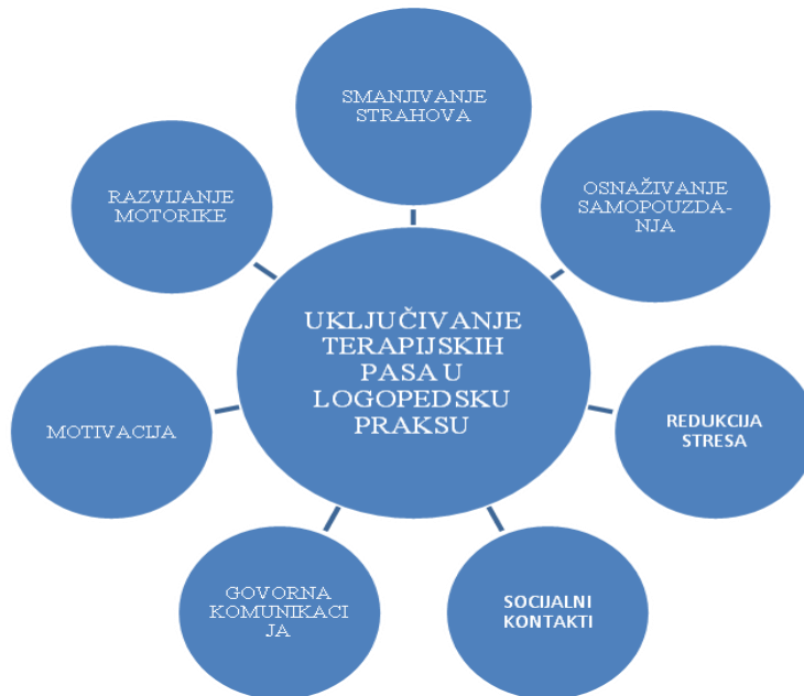
Prikaz 2. Uključivanje terapijskih pasa u logopedsku praksu (prema Bohnen, 2015).

Bohnen (2015) klasificira ciljeve uključivanja terapijskih pasa u logopedsku praksu: