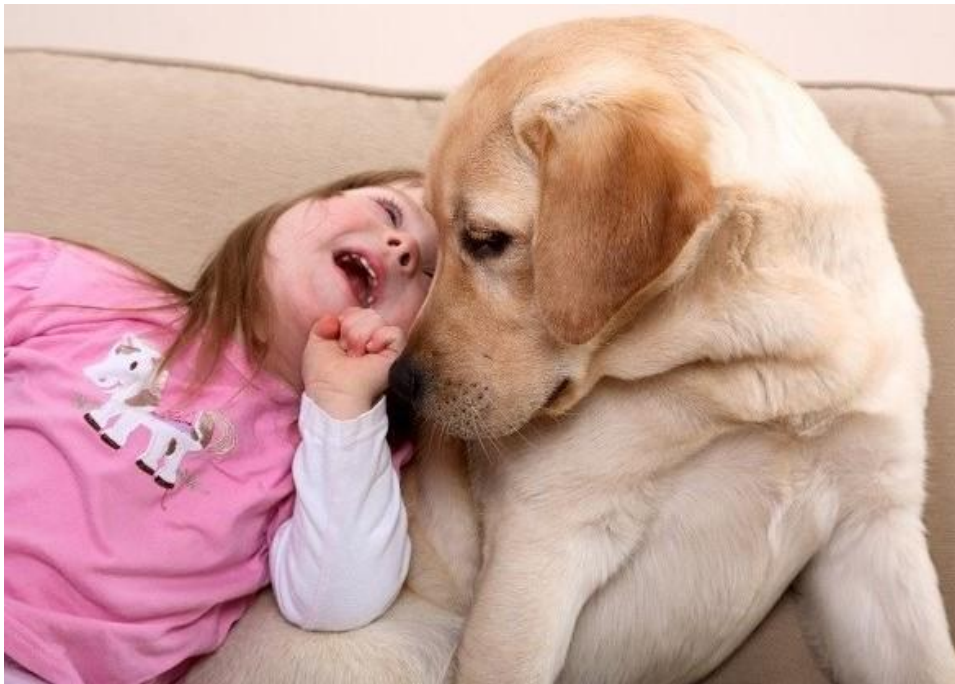
Slika 1. Terapijski pas s djevojčicom s Downovim sindromom

Uz brojne navedene koristi rada s terapijskim psom, postoje i teškoće koje se ponekad javljaju na razini interakcije čovjeka i psa i koje predstavljaju potencijalnu opasnost za uspješnost same terapije. Burch (1996, 2003; prema Chandler 2005) ističe da su neki ljudi alergični na pse, te da neki imaju mišljenje da psu nije mjesto u kući, već izvan kuće u dvorištu. Teškoću može predstavljati i činjenica da pas zahtijeva dosta njege i treninga, a hrana i voda mora biti uvijek na raspolaganju kada je pas zatreba. Isto tako, potrebno je uložiti dosta vremena u trening psa na otvorenim prostorima kako bi se pas mogao odmoriti i istegnuti mišiće. Poteškoćom se smatra i činjenica da se neki ljudi boje psa, te da se čak i neki članovi osoblja u različitim ustanovama mogu bojati psa. Nadalje, ponekad se događa da se kod psa neočekivano pojave problemi u ponašanju. Isto tako, psi imaju kraći životni vijek nego ljudi i treba ih isključiti iz terapije kada zbog starosti terapijski proces postaje neugodan ili pretežak. Tako najčešće pas kojeg smo odabrali za koterapeuta može ostati u ulozi pomagača najviše deset godina ili manje, ovisno o dobi u kojoj je pas počeo s uključivanjem u terapiju, te pasmini i zdravstvenom stanju psa. To ponekad može dovesti do komplikacija kod klijenata kojemu će pas nedostajati kada prestane njegovo uključivanje u terapijski proces.