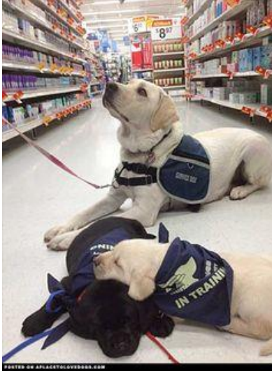
Slika 2. Terapijski psi u procesu treniranja, (preuzeto s: https://www.pinterest.com/oddbits/clumsy-clever-comely-canines/ )

Možemo primijetiti da unaprijeđivanje postupaka odabira terapijskih pasa smanjuje broj pasa koji bivaju isključeni iz terapije i time povećavaju broj klijenata kojima terapija potpomognuta psima može biti korisna.