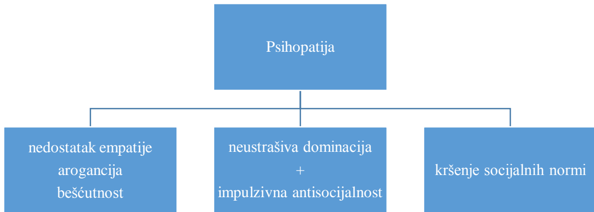
Slika 3 – Shematski prikaz odlike osoba s psihopatijom

je IA povezana s agresivnim, impulzivnim, a često i kriminalnim ponašanjima (Heritage, 2013).