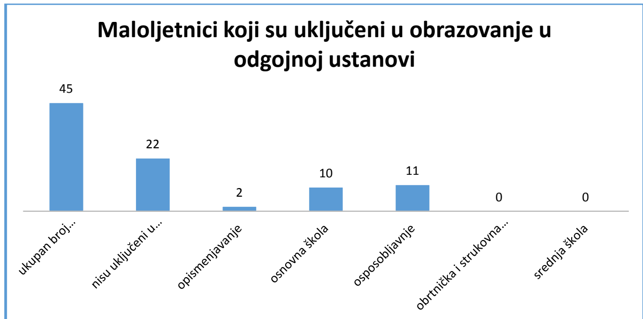
Slika 3. Maloljetnici koji su uključeni u obrazovanje u odgojnoj ustanovi 2016. godine

maloljetnika bilo je također između 16 i 18 godina života. Nedostatak obrazovanja kočnica je svakom napretku i integraciji, a većina ovih mladih osoba su stariji maloljetnici koji će uskoro biti punoljetni i od njih će se očekivati da preuzmu odgovornost za svoj život. Slika koja slijedi daje prikaz maloljetnika koji su 2016. godine bili uključeni u sustav obrazovanja i osposobljavanja za vrijeme boravka u instituciji.