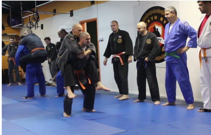
Slika 6 Čučnjevi s partnerom na ledima

čemu se mijenjaju partneri nakon određenog vremena, dok se na videozapisu MVI_7720 vide borbe s primjenom tehnika poluga ( kansetsu waza ).