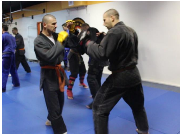
Slika 7 Borba s jednim napadačem

Videozapisi MVI_7733, 7734, 7736, 7737 i 7738 prikazuju kratke borbe s izmjenom partnera u kojima polagači primjenjuju tehnike udaraca rukama i nogama. Nakon borbi s jednim napadačem, slijede borbe s dva napadača što je prikazano na videozapisima MVI_7749 i 7750, a zatim borbe s tri napadača u videozapisima MVI_7753 i 7754.