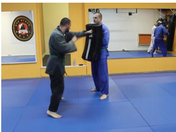
Slika 14 Uvježbavanje udaračkih tehnika s fokuserima 1

Posljednji dio treninga podrazumijevao je vježbanje s partnerom tijekom kojeg su se koristili jastuci fokuseri prikladni za uvježbavanje udaračkih tehnika. Videozapis MVI_8619 prikazuje N koji uvježbava udarce rukama i nogama usmjerene na trup partnera koji na prsima drži fokuser, dok u videozapisu MVI_8620 N drži fokuser na svojim prsima, a partner udara. Trener intervenira davanjem verbalne upute N kako pravilno držati fokuser.