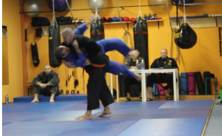
Slika 2 Demonstracija bočnih bacanja

Prilikom ispitivanja parternih tehnika ( ne waza ) N s partnerom demonstrira oslobađanje iz zahvata, ali dolazi do nesporazuma oko završavanja tehnike te se kroz dijalog s trenerom pojašnjavaju nejasnoće.