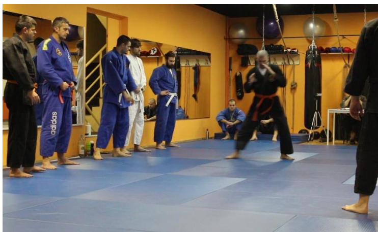
Slika 1 Kretanje u borbenom stavu

Nakon tehnika stavova, ispituju se tehnike blokada ( uke ) pa se na videozapisu MVI_7683 vidi N kako demonstrira školske tehnike blokada, tj. gornji ( age uke ) i donji blok ( gedan barai ). Nakon toga opisuje i demonstrira školsku tehniku stava zenkutsu dachi . Na temelju viđenog, trener daje pohvalu N.