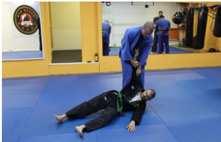
Slika 10 Tehnika bacanja 1

Na ovom treningu uvježbavale su se različite tehnike bacanja čija složenost ovisi o pojasu koji osoba ima. Videozapisi MVI_8095 i 8097 prikazuju uvježbavanje ove tehnike. N partner daje verbalne upute istovremeno ga vodeći korak po korak kroz tehniku. Uz to, trener također pruža podršku N i partneru verbalnim uputama.