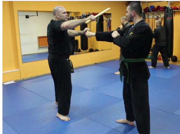
Slika 22 Korištenje palice u samoobrani 2

Drugi dio treninga uključivao je borbe s izmjenom partnera u kojima su se koristile tehnike udaraca rukama i nogama te tehnike blokada što je prikazano na videozapisima MVI_2194, 2195, 2197 i 2198.