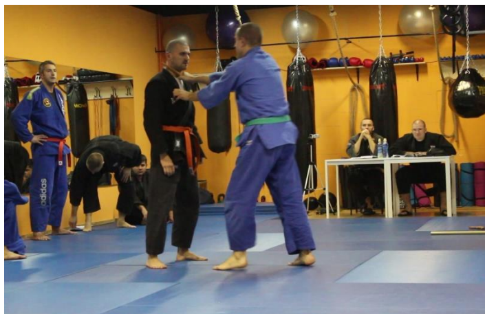
Slika 4 Samoobrana od naoružanog napadača (nož)