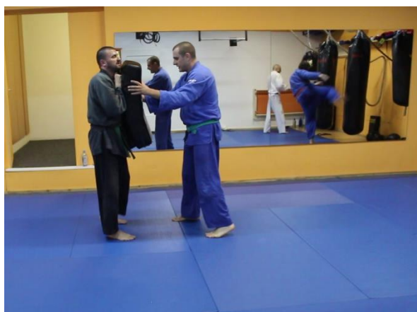
Slika 18 Uvježbavanje udaračkih tehnika s fokuserima 2

Na videozapisima MVI_8621 i 8622 se vidi korištenje fokusera na gornjem dijelu noge, odnosno bedru, prilikom čega trener daje verbalne upute i fizičku podršku N za pravilno izvođenje udaraca nogom usmjerenih na taj dio tijela, a potom i za pravilno držanje fokusera na svojoj nozi.