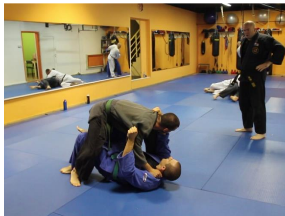
Slika 16 Tehnika bacanja 2

Nakon uvježbavanja novih tehnika bacanja, slijedile su borbe s različitim partnerima tijekom kojih su se koristile udaračke i parterne tehnike što se može vidjeti na videozapisima MVI_8615, 8616 i 8617.