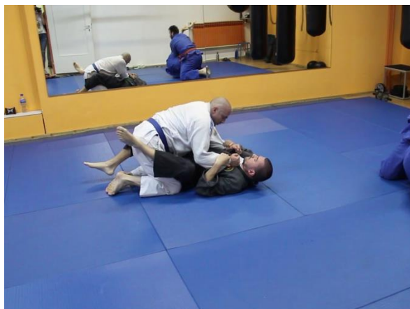
Slika 14 Oslobađanje iz zahvata držanja 2

Na kraju treninga, koji je prikazan na videozapisima MVI_8403 i 8404, svatko se individualno kreće po dvorani i izvodi udarce, a na trenerov znak traži partnera s kojim će se boriti dok trener ne da novi znak za individualni rad. Partneri se izmjenjuju na svaki novi znak za borbu, stoga N podizanjem ruke uvis daje znak ako nema partnera.