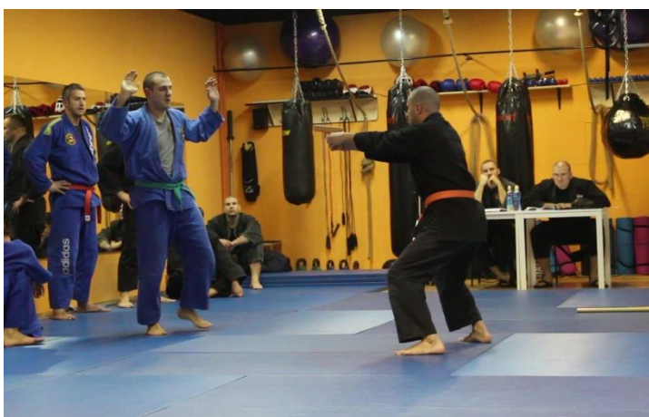
Slika 5 Samoobrana od naoružanog napadača (pištolj)