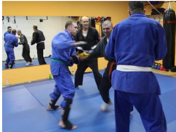
Slika 8 Borba s tri napadača

Završni dio polaganja uključuje pojedinačne borbe s više napadača, a broj napadača i trajanje borbe ovise o pojasu za koji se polaže. Na videozapisu MVI_7813 nalazi se N završna borba koja podrazumijeva 10 uzastopnih i kratkih borbi, svaka u trajanju od 30 sekundi. Na kraju borbi N dobiva pljesak i pohvalu za dobro odrađene borbe te se s tim završava polaganje.