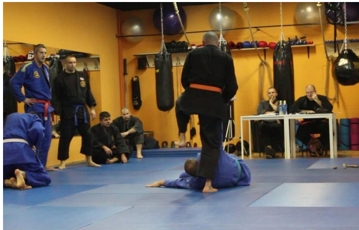
Slika 3 Samoobrana od nenaoružanog napadača

Na posljednjem videozapisu MVI_7698 N s partnerom pokazuje tehnike samoobrane protiv nenaoružanog, a zatim naoružanog napadača što uključuje obrane od gušenja, hvatova, napada palicom, nožem i pištoljem. Na kraju demonstracije trener traži pljesak za N izvedbu.