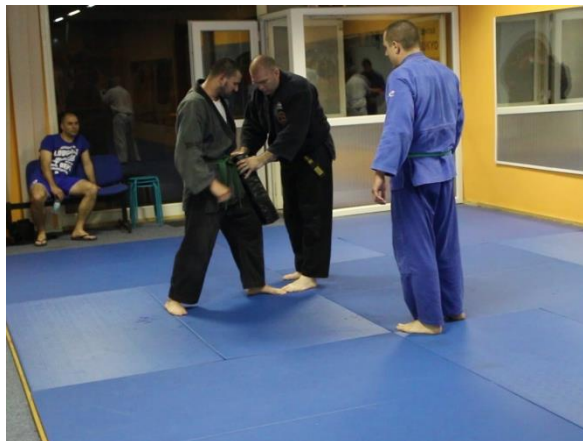
Slika 20 Uvježbavanje udaračkih tehnika s fokuserima 4