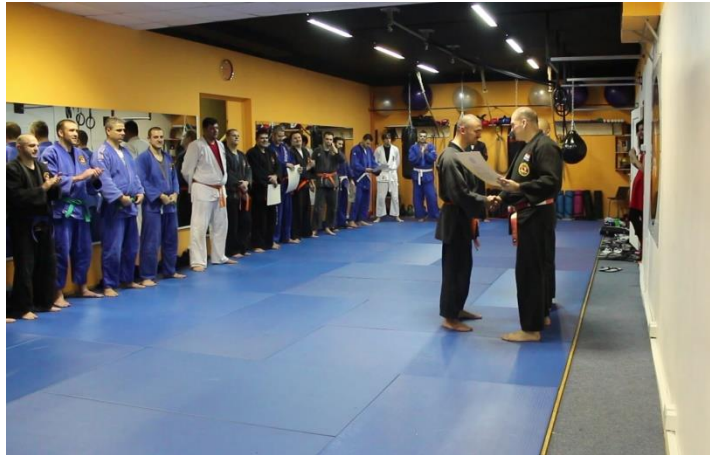
Slika 8 Dodjela diplomi

vidjeti na videozapisu MVI_7817, dok videozapis MVI_7818 prikazuje N koji također drži kratki govor u kojem zahvaljuje treneru, kolegama i partneru s kojim se pripremao za polaganje.