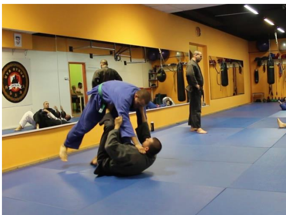
Slika 13 Tehnika bacanja 1