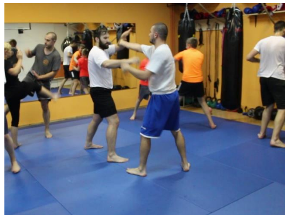
Slika 24 Sparing