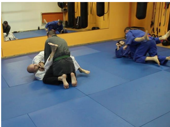
Slika 12 Oslobađanje iz zahvata držanja 1