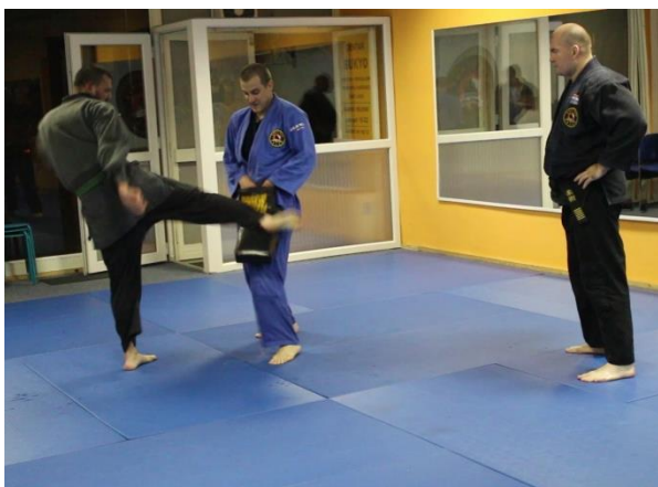
Slika 15 Uvježbavanje udaračkih tehnika s fokuserima 3