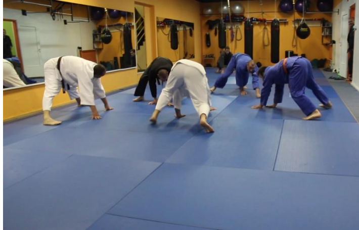
Slika 9 Zagrijavanje igranjem lovice četveronoške

Na ovom treningu uvježbavale su se različite tehnike bacanja čija složenost ovisi o pojasu koji osoba ima. Videozapisi MVI_8095 i 8097 prikazuju uvježbavanje ove tehnike. N partner daje verbalne upute istovremeno ga vodeći korak po korak kroz tehniku. Uz to, trener također pruža podršku N i partneru verbalnim uputama.