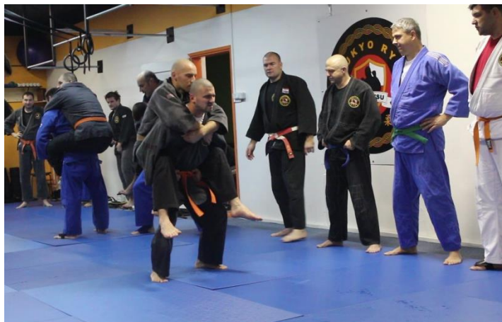
Slika 6 Čučnjevi s partnerom na ledima

čemu se mijenjaju partneri nakon određenog vremena, dok se na videozapisu MVI_7720 vide borbe s primjenom tehnika poluga ( kansetsu waza ).