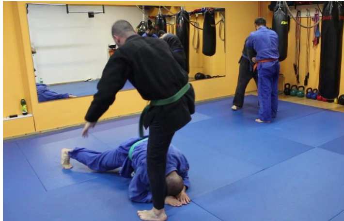
Slika 11 Tehnika bacanja 2

Nakon uvježbavanja tehnika bacanja, uključuju i tehnike poluga što je prikazano na videozapisu MVI_8098, dok se na videozapisu MVI_8099 vidi uvježbavanje blokada i udaraca. Tijekom cijelog uvježbavanja N partner daje dodatna objašnjenja.