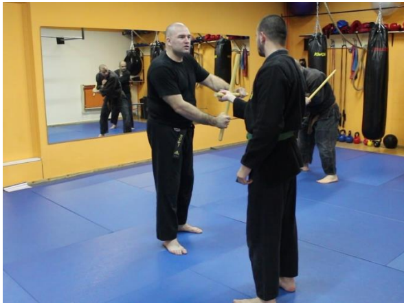
Slika 16 Korištenje palice u samoobrani 1