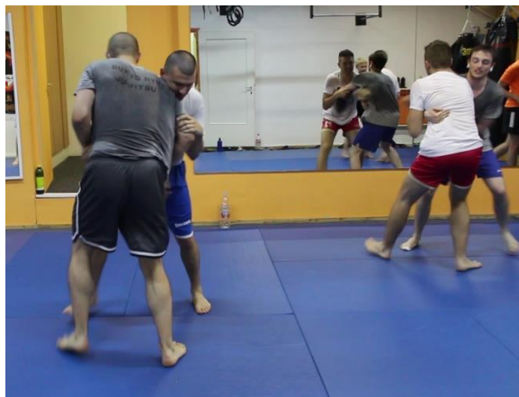
Slika 17 Hrvanje

kojih se koriste tehnike udaraca s početka treninga. Mlađi članovi koji još nisu bili u kontaktu s N izbjegavaju pristupiti mu u sparinzima, stoga ih trener potiče na sparinge s njim, a N im daje upute kako zapravo vježbati s njim u paru.