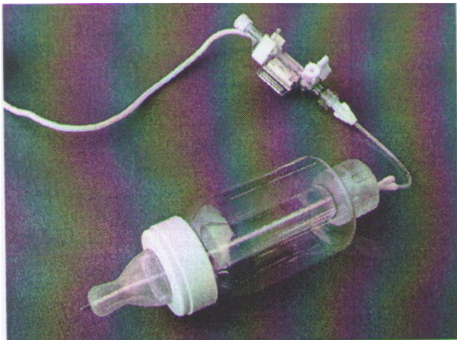
Slika 2. Umjetna bradavica u kombinaciji s kompresijskom bočicom (Reid i sur., 2007).

Kompresijske bočice omogućuju osobi koja hrani dijete, transfer mlijeka ukoliko dijete nije u mogućnosti samostalno uspostaviti obrazac sisanja i izvlačenja tekućine iz bočice. Međutim, ove tvrdnje imaju vrlo slab dokaz učinkovitosti (Slika 2).