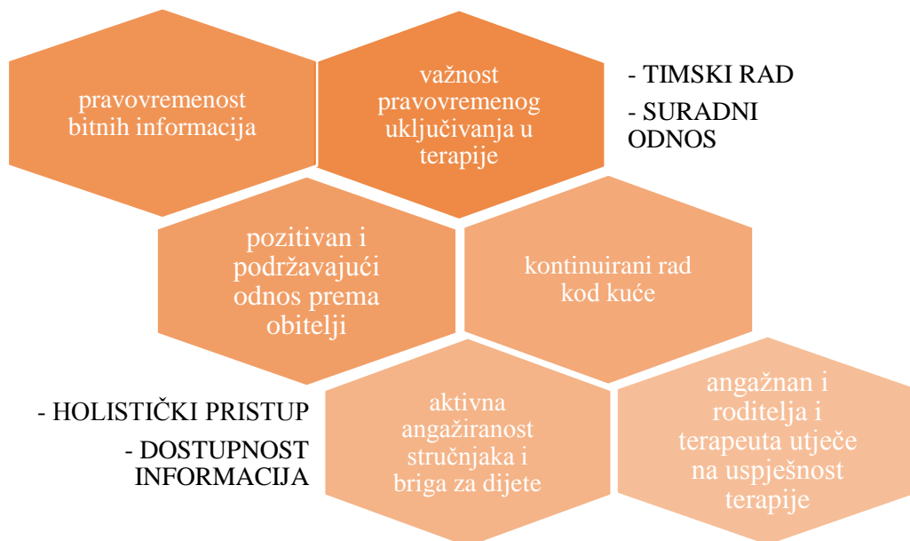
Tablica 6. Bitne odrednice rane intervencije

Kao bitne odrednice uspješnosti rane intervencije izdvaja se: pravovremenost bitnih informacija, važnost pravovremenog uključivanja u terapije, suradnja s obitelji kao najbitnija stvar, pozitivan i podržavajući odnos prema obitelji te važnost kontinuiranog rada kod kuće te da angažman i roditelja i terapeuta utječe na uspješnost terapije.