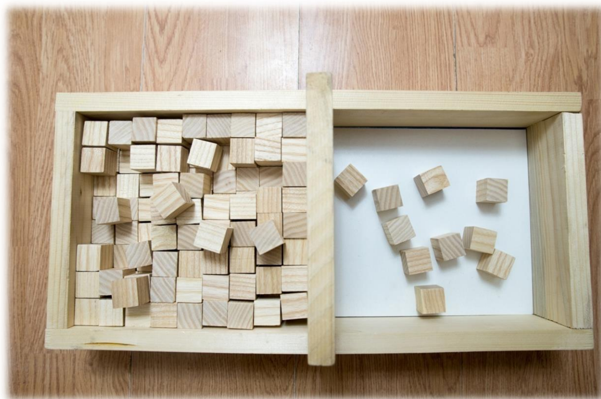
Slika 1 Box and Block Test