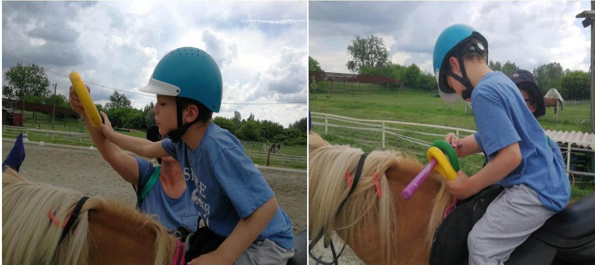
Fotografija 5 a) i 5 b):uzimanje koluta i skidanje i stavljanje na štap