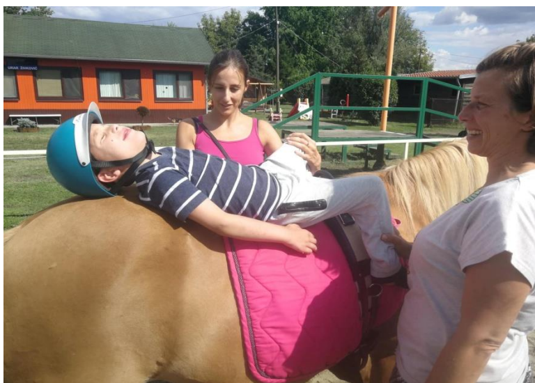
Fotografija 12: ležanje na leđima konja