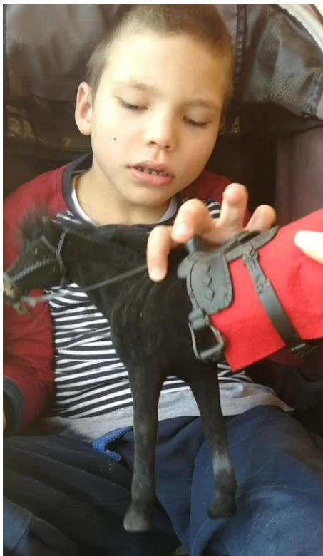
Fotografija 6: Učenje dijelova tijela i svijesti o sebi i položaju tijela u prostoru