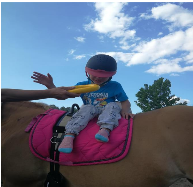
Fotografija 13: Dohvaćanje koluta u sjedećem položaju sa strane