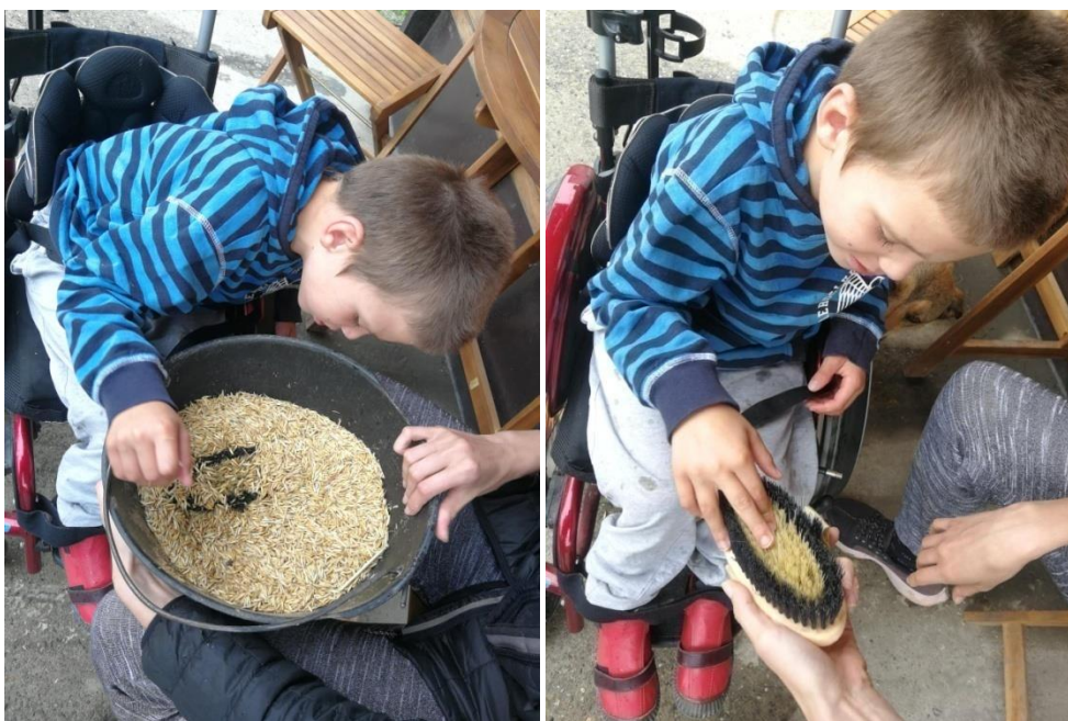
Fotografija 4 a) i 4 b): Traženje četke u kanti zobi te prelaženje prstima preko četke