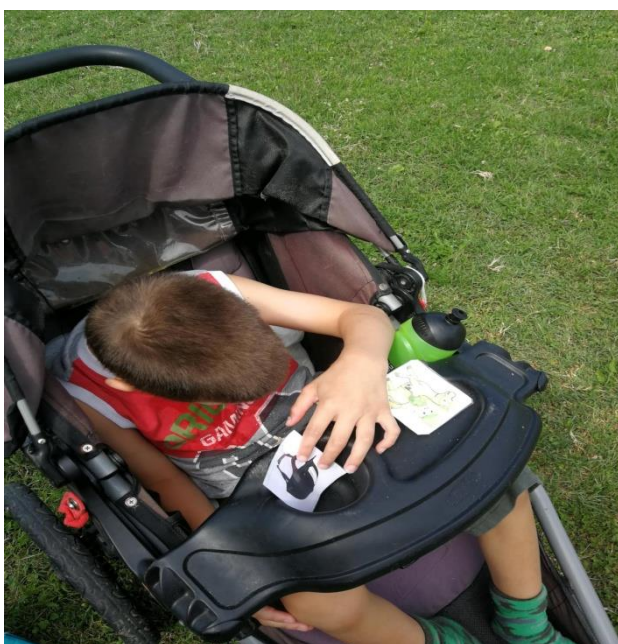
Fotografija 14: Vizualne kartice, stavljanje kacige