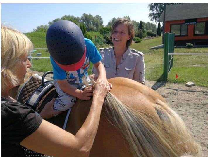
Fotografija 10: Taktilni senzorni unos: diranje repa konja