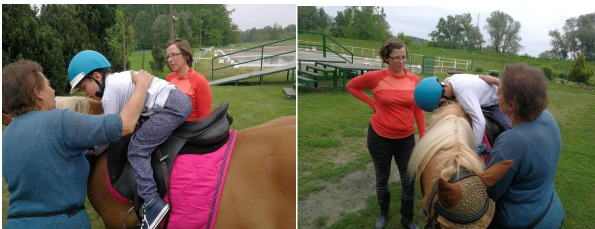
Fotografija 3 a) i 3 b): naslon prema naprijed na vrat konja