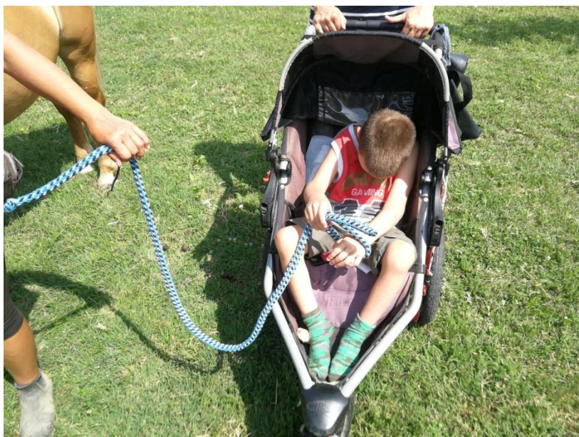
Fotografija 15: Držanje povodca i konja na paši