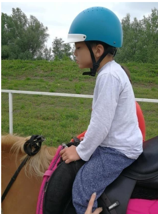
Fotografija 1 a) i 1 b): prikaz početnog stanja posture i položaja u sedlu i nakon provedenog programa