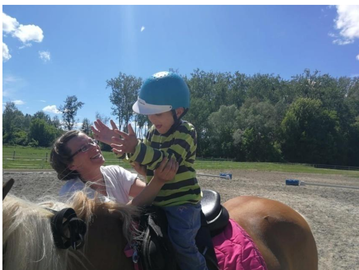
Fotografija 2: imitacija i pljeskanje u igri u stoju