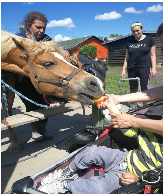
Fotografija 7: Hranjenje konja te prinošenje ruke ustima i njušci