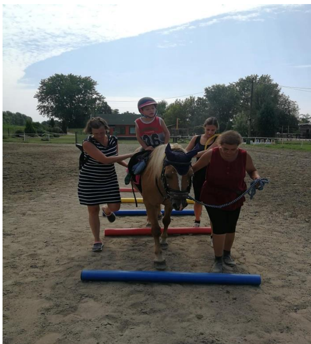
Fotografija 11: poligon i održavanje ravnoteže