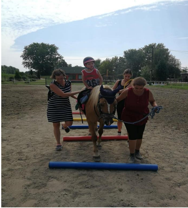
Fotografija 11: poligon i održavanje ravnoteže