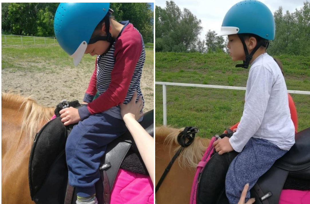
Fotografija 1 a) i 1 b): prikaz početnog stanja posture i položaja u sedlu i nakon provedenog programa