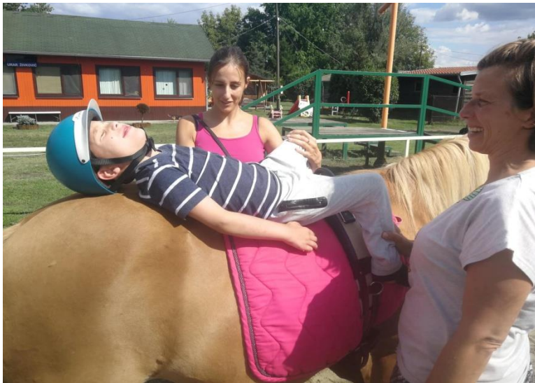
Fotografija 12: ležanje na leđima konja