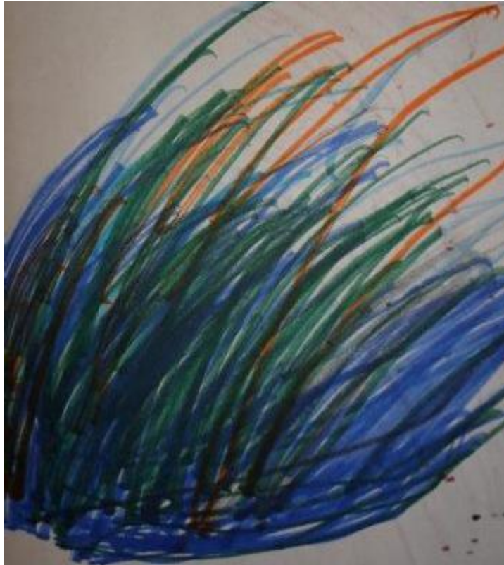
Slika 5: Kevinovo slobodno crtanje flomasterima