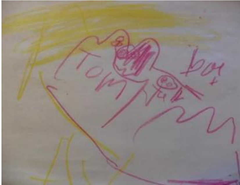
Slika 7: Tommy i Jon na vrhu ljubičaste planine pokraj žute rijeke