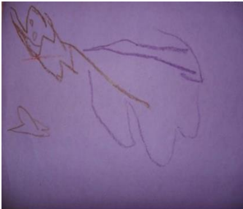
Slika 8: Ljubičasti dinosaur

Dajući Tommyu slobodu i ohrabrenje da stvori sliku po vlastitom izboru, pružajući materijale, podršku i ugodno okruženje, mogao se opustiti. Kako su bojice klizile po papiru, on je gledao kako se stvaraju forme i uspio je identificirati, opisati i nazvati svoje stvaranje. Nakon što je dobio priliku da se usmjeri i kanalizira svoju energiju u procesu stvaranja, činilo se kao da se uspijeva izraziti puno lakše.