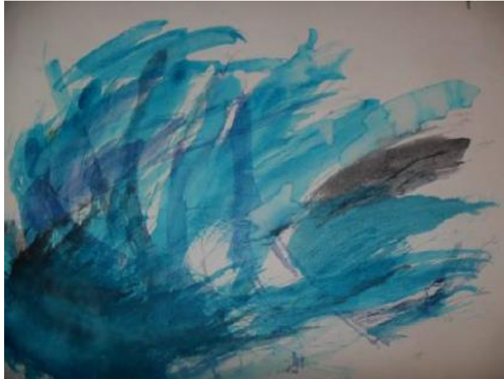
Slika 4: Kevinovo stvaranje vodenim bojicama