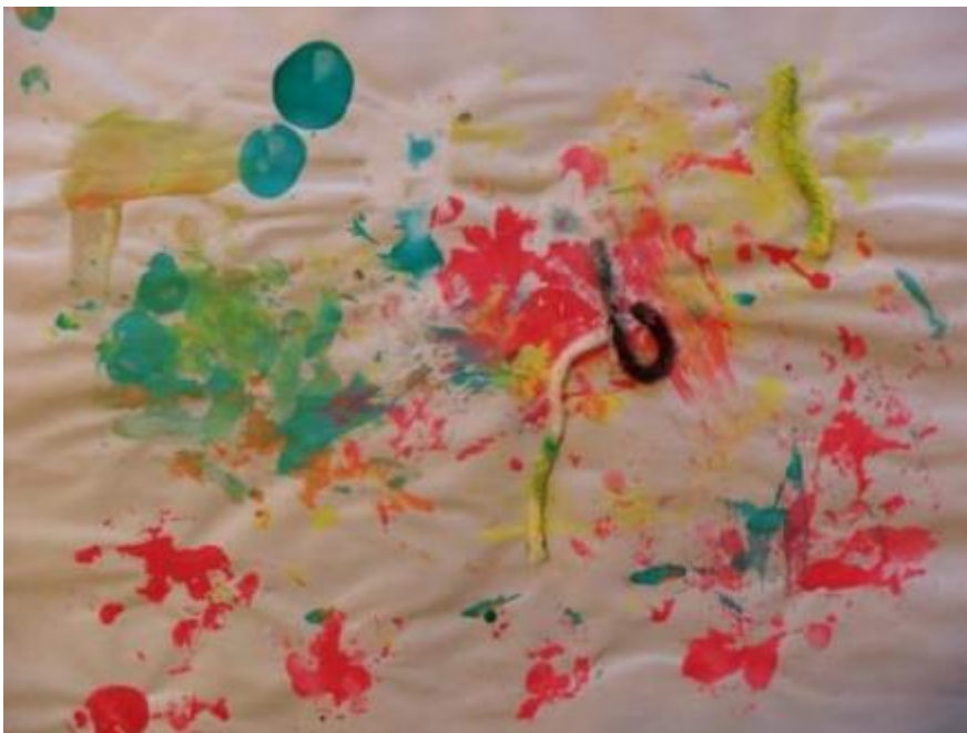
Slika 10: Slikanje vunom

S obzirom na priliku da istraži nove materijale i metode izražavanja, Tommyu se pružio novi izlaz za oslobađanje unutarnjih tjeskoba i frustracija. Naposljetku se umorio od korištenja vune, pa je malo slikao i prstima. Povremeno bi Tommy pogledao terapeutkinju i tijekom procesa udario šakom u stol. On bi to učinio nakon i između odabira novog komada vune i umakanja u boju. Pokret laganog udaranja šakom bio je ugodna i rutinska akcija za Tommya tijekom koje je oslobađao svoju tjeskobu. Obzirom da ga se nije osuđivalo kada bi to učinio, on je uspio zadržati svoju koncentraciju na stvaranju slike.