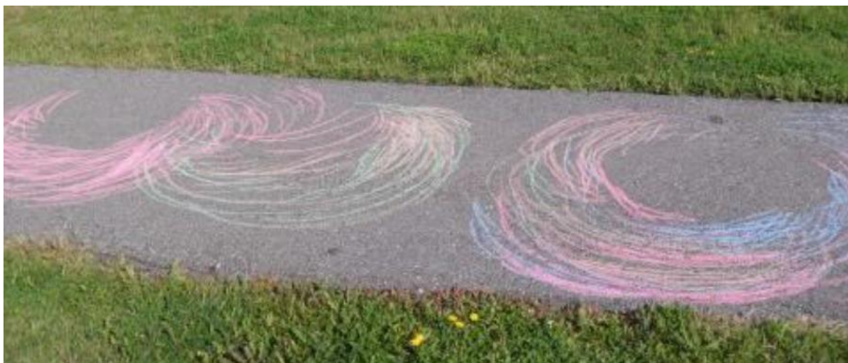
Slika 6: Kevinovi crteži kredom na pločniku

Kako su prolazile Kevinove likovne terapijske seanse, on je počeo iskazivati želju da svakodevno sudjeluje u umjetnosti. Likovna terapija pružila je Kevinu izlaz koji prethodno nije imao. Kroz umjetnost, Kevin je dobio priliku da svoju agresiju kanalizira i izrazi se na drugom jeziku.