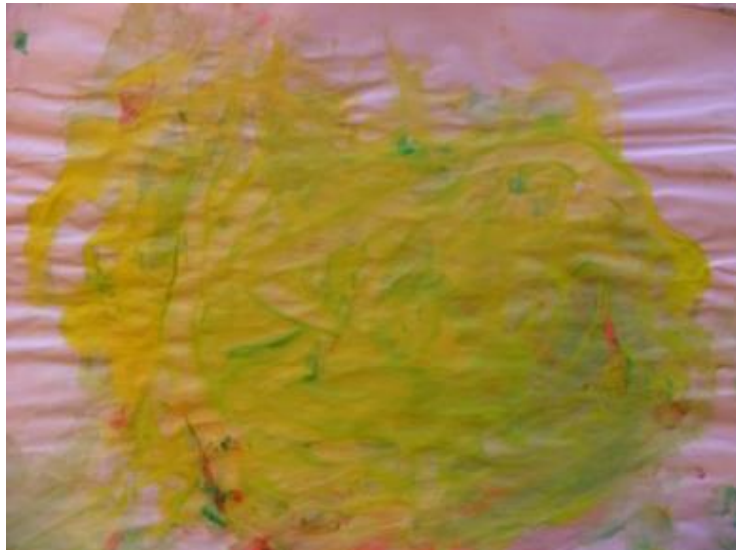
Slika 9: Stablo

Eksperimentirajući s regresivnim materijalom, Tommy se slobodno izrazio u okruženju bez prosudbe. Nije ga se ispravljalo, molilo da bude tiši, ograničavalo, ili ohrabivalo da smiri svoje ponašanje. Umjesto toga, činilo se da Tommy napreduje na prihvaćanju malo divljeg ponašanja. U procesu slikanja bez kista, Tommy se hihotao i smijao tijekom cijelog procesa. Imao se priliku igrati. Kada je završio, objasnio je da je njegova slika bila stablo.