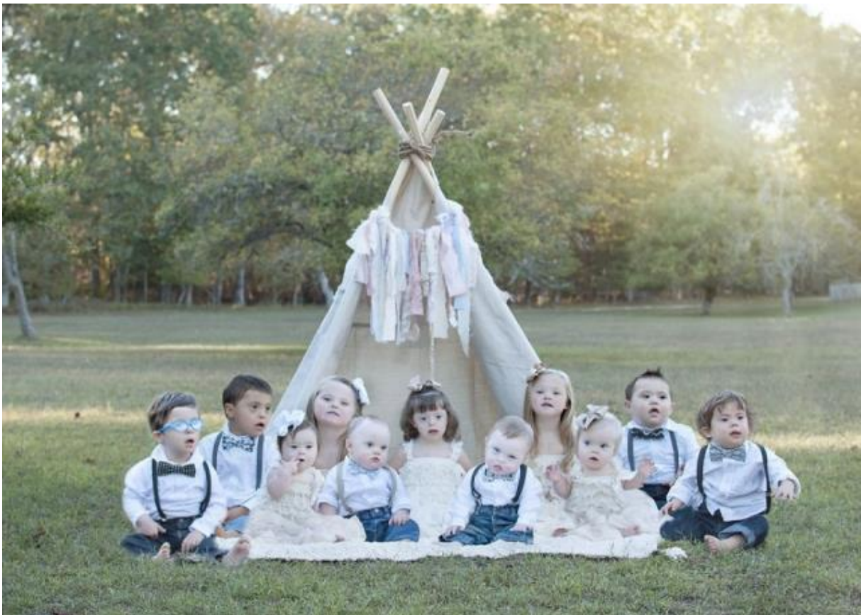
Slika 3: Specifičnosti izgleda djece s Down sindromom