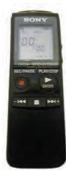
Slika 10. Digitalni snimači ili diktafoni za osobe oštećena vida

Jedan od takvih je Sony PX720 uređaj za snimanje i reproduciranje zvuka raspolaže memorijom od 64 Mb što je dovoljno za 7 sati neprekidnog snimanja odličnog kvaliteta. Može se povezati sa računarom USB priključka. Softver za prebacivanje snimaka i podešavanje postavki diktafona je kompatibilan s čitačima ekrana kao što je primjerice JAW for Windows koji je već navođen (Lazor, 2017).