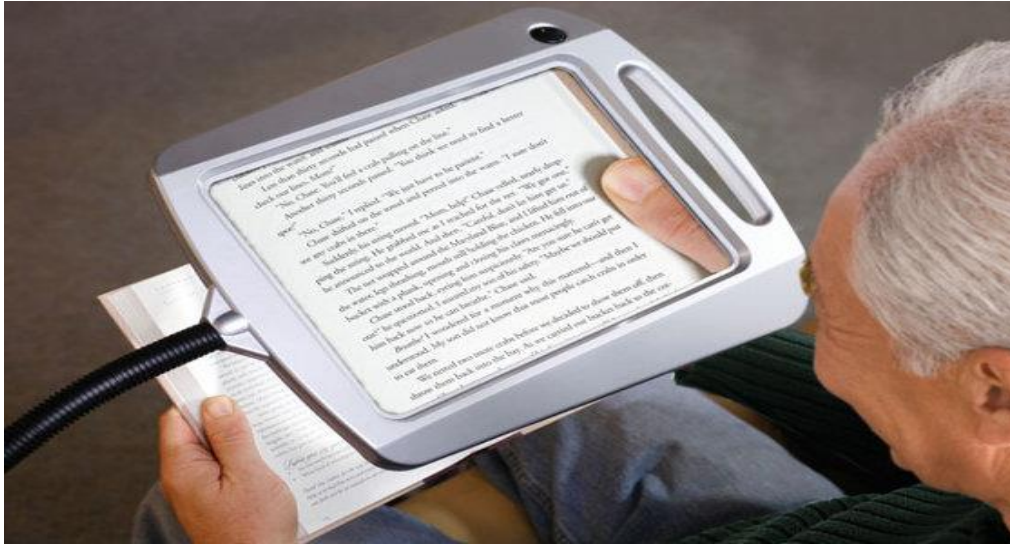
Slika 6. Povećalo za slabovidne

ručnih lupa ako se osobi tresu ruke, što je često kod starijih, pa teško održavaju sliku u fokusu), te da je mala maksimalna udaljenost promatranog predmeta od povećala (Optometrija, 2015).