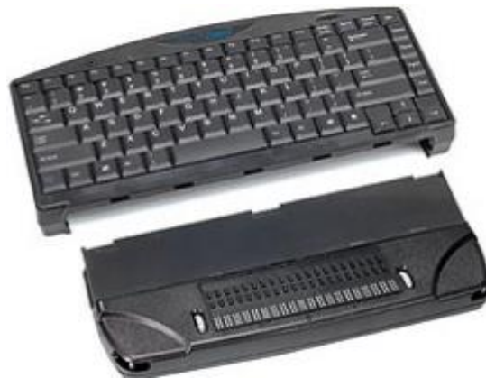
Slika 3. Univerzalna Brailleova tipkovnica

Ovaj proizvod je na bazi računalnog programa, koji se implementira u operativni sustav korisnika, te se automatski pokreće i omogućava korištenje računalne tastature kao Brailleovog pisaćeg stroja u bilo kojoj aplikaciji. Korisnik u svakom trenutku može koristiti standardnu tipkovnicu, ili svoju tipkovnicu pretvoriti u Brailleov pisaći stroj, te na njoj pisati kao na mehaničkom Brailleovom pisaćem stroju koristeći šestotačkasto, ili osmotačkasto Brailleovo pismo (Hrvatski savez slijepih).