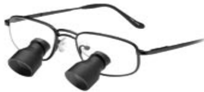
Slika 9. Elektronički teleskop za osobe oštećena vida

Elektronički teleskopi se mogu usporediti s videokamerama, samo što oni ne spremaju snimljene informacije. Uređaj je postavljen na korisnikove oči. Elektroničke komponente dopuštaju korisniku da se približava odnosno udaljava od objekta koji se promatra. Također, uređaj ima i kontrolu za podešavanje kontrasta i svjetline što olakšava gledanje u tamnijoj okolini, kao što je kazalište (Presley i D'Andrea, 2008).