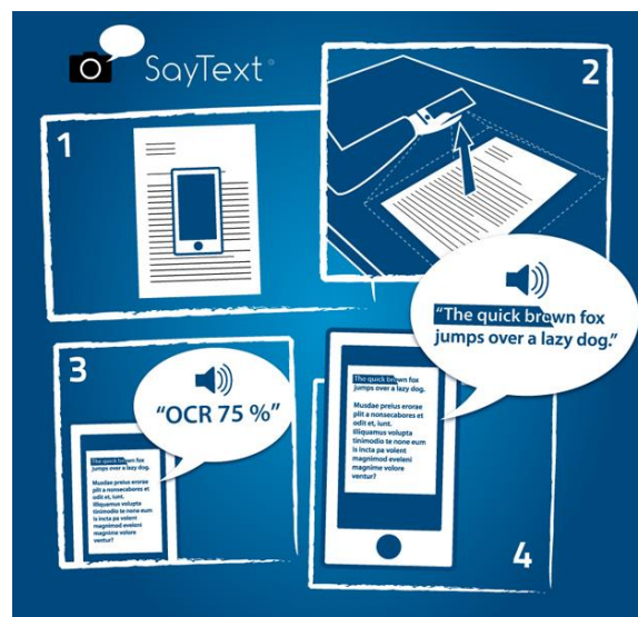
Slika 14. Prikaz korištenja aplikacije SayText

zatvoreni operativni sustav, pa razmjena aplikacija, tj. standardna virtualna tipkovnica s virtualnom Brailleovom pločom nije moguća (Wong i Tan, 2012). Zbog vrlo dobrog čitača zaslona, iOS-u ne trebaju opsežne aplikacije za podršku osobama s invaliditetom. Međutim, u AppStoreu se može naći softver koji dodaje zanimljive značajke. Vodeće među softverom su varijacije na optičkom prepoznavanju znakova (OCR), tj., SayText , Prizmo i TextDetective . Korisnik SayText-a mora mobilni uređaj staviti na dokument fotoaparatom okrenutim prema dolje, a zatim polako podići uređaj prema gore. Kamera snima fotografiju, a zatim rezultat prevodi u tekst (Wong i Tan, 2012). Kada se dokument pretvori, korisnik može prstom povući udesno da bi čuo tekst.