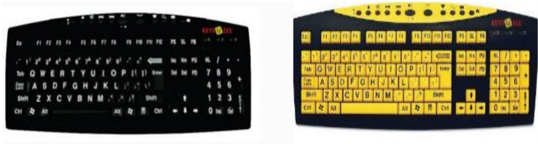
Slika 5. Tipkovnice za slabovidne osobe

Tipkovnice predstavljaju 'pomagalo' koje sa većim tasterima više odgovaraju osobama sa oštećenjem vida. Ove tipkovnice su također većih dimenzija, a mogu biti izrađene u kontrastima crno-žute i crno-bijele boje sa velikim tasterima, na kojima su kontrastnom bojom utisnuta slova, brojevi i sve ostale oznake koje se nalaze na standardnim testaturama. Veličina i boja tastera omogućavaju optimalan kontrast i olakšavaju korištenje računara (Teskeredžić i sur., 2013).