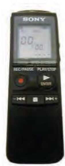
Slika 10. Digitalni snimači ili diktafoni za osobe oštećena vida

Jedan od takvih je Sony PX720 uređaj za snimanje i reproduciranje zvuka raspolaže memorijom od 64 Mb što je dovoljno za 7 sati neprekidnog snimanja odličnog kvaliteta. Može se povezati sa računarom USB priključka. Softver za prebacivanje snimaka i podešavanje postavki diktafona je kompatibilan s čitačima ekrana kao što je primjerice JAW for Windows koji je već navođen (Lazor, 2017).