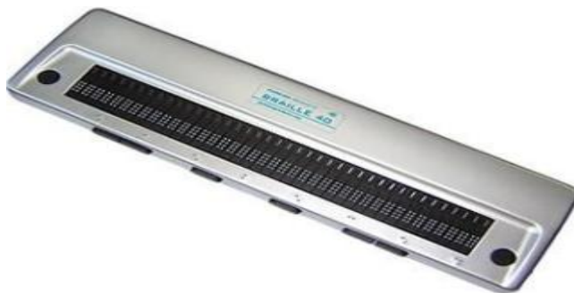
Slika 1. Brailleov redak od 40 slovnih mjesta

Brailleov red prikazuje tekst na Brailleovom pismu sa šest ili osam točaka. Brailleov redak sadrži niz od 20, 40 ili 80 slovnih mjesta. Svaka ćelija sadrži od 6 ili 8 iglica koje se pomjeraju u gornji ili donji položaj i tako formiraju slovo ili znak Brailleovog pisma.