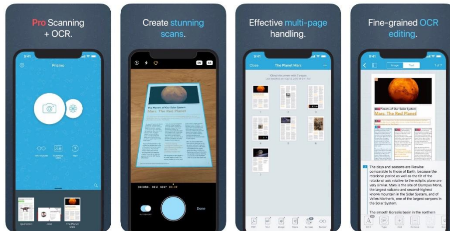
Slika 15. Prikaz korištenja aplikacije Prizmo

TextDetective korisniku omogućuje čitanje, uređivanje i kopiranje prepoznatog teksta sa slike. Ova je mobilna aplikacija relativno jednostavna za korištenje. Korisnik mora uređaj držati u pejzažnom načinu. Da biste mogli koristiti aplikaciju, lijevi rub pametnog telefona mora biti poravnat s rubom dokumenta, a zatim uređaj mora biti podignut dok se ne nalazi oko 20 do 30 cm od dokumenta (Adam, 2017). Skeniranje započinje kada korisnik dodirne odgovarajuću tipku zaslona. Kad TextDetective pronađe dokument, telefon će vibrirati. To može potrajati nekoliko sekundi, ali sintesajzer će govoriti o napretku konverzije. Pišući o mobilnim aplikacijama, vrijedno je spomenuti još jedan, odnosno Money Reader koji radi samo s novcem (Lewis, 2016). Aplikacija prepoznaje valutu i govori naziv, koja uveliko može pomoći osobama s oštećenjem vida. Kamera 'pametnih uređaja' mora biti usmjerena na račun i aplikacija će u stvarnom vremenu navesti naziv. Aplikacija se može koristiti tijekom kupovine radi provjere novca.