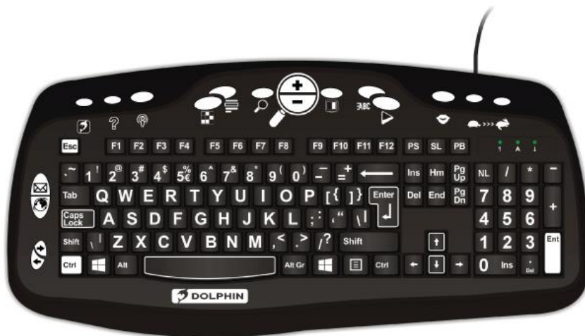
Slika 16. Dolphin Large Print tipkovnica

Korištenje prepoznavanja glasa ili govora za upravljanje računalom i kombiniranjem ovog teksta s tekstom u govor uklanjaju potrebu za fizičkim tipkanjem ili gledanjem zaslona. Kao i svaka nova vještina, kontrola glasa može zahtijevati malo strpljenja za učenje, ali može biti posebno učinkovita za osobe sa oštećenjem vida (Leibs, 2020). Većina operativnih sustava računala, tableta i pametnih telefona ugrađeni su prepoznavanje glasa, što korisniku omogućuje davanje naredbi kao što su otvaranje programa ili aplikacija i diktiranje teksta, a mogućnosti se neprestano razvijaju i poboljšavaju.