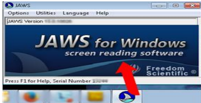
Slika 4. JAWS for Windows najpopularniji čitač ekrana ( screen reader )

Screen reader JAWS for Windows , je najpopularniji i najkorišteniji čitač ekrana ( screen reader ) na svijetu. Distribuirana se širom svijeta u više od 50 zemalja i preveden je na 23 jezika. JAWS omogućava slijepim i slabovidim osobama da ravnopravno koriste većinu aplikacija na računalu, prati aktivnosti korisnika na računalu (pritisnute tastere i komande) i čita sadržaj ekrana. Aktivnosti korisnika i sadržaj ekrana pretvara u tekst i šalje na Brailleov redak – display ili sintetizator govora (Teskeredžić i sur., 2013).