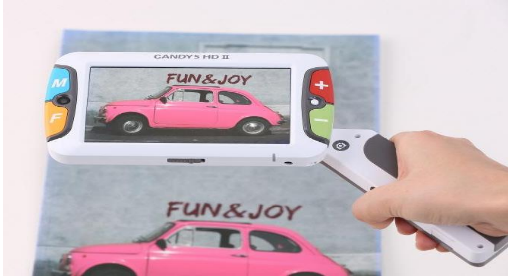
Slika 8. Prijenosno povećalo Handy 5 HD II