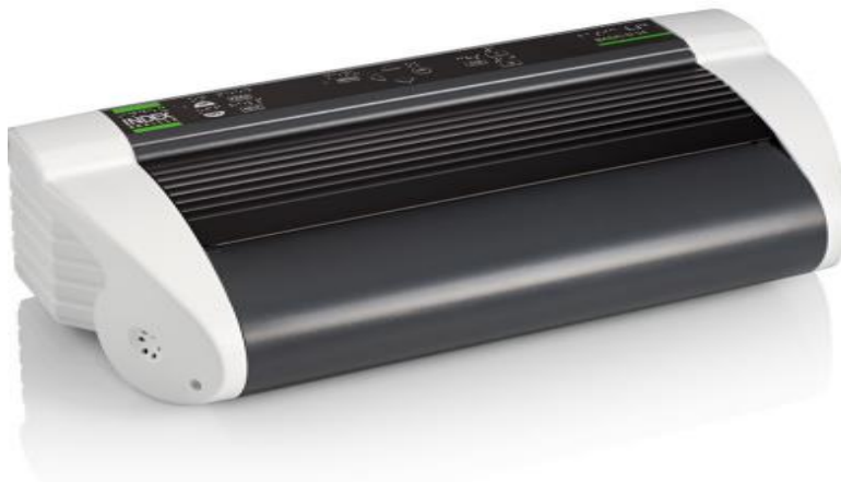
Slika 2. Brailleov printer – emboser

Basic-D je klasični dvostrani Brailleov printer ( emboser ). Njegov WinBraille editor, je jedan od najboljih i najprilagodljivijih na tržištu. Za prosječnog korisnika postoji besplatna verzija ovog programa. Basic-om se upravlja pomoću tastera za upravljanje. Ispisani su na crnom tisku, Brailleovom pismu i pritiskom na njih oni izgovaraju svoju funkciju, čime omogućavaju slijepim i slabovidim korisnicima brzo, jednostavno i samostalno instaliranje i rukovanje. Basic je jedan od najpouzdanijih klasičnih Braillevih štampača koji štampaju na perforiranom beskonačnom papiru (Teskeredžić i sur., 2013).