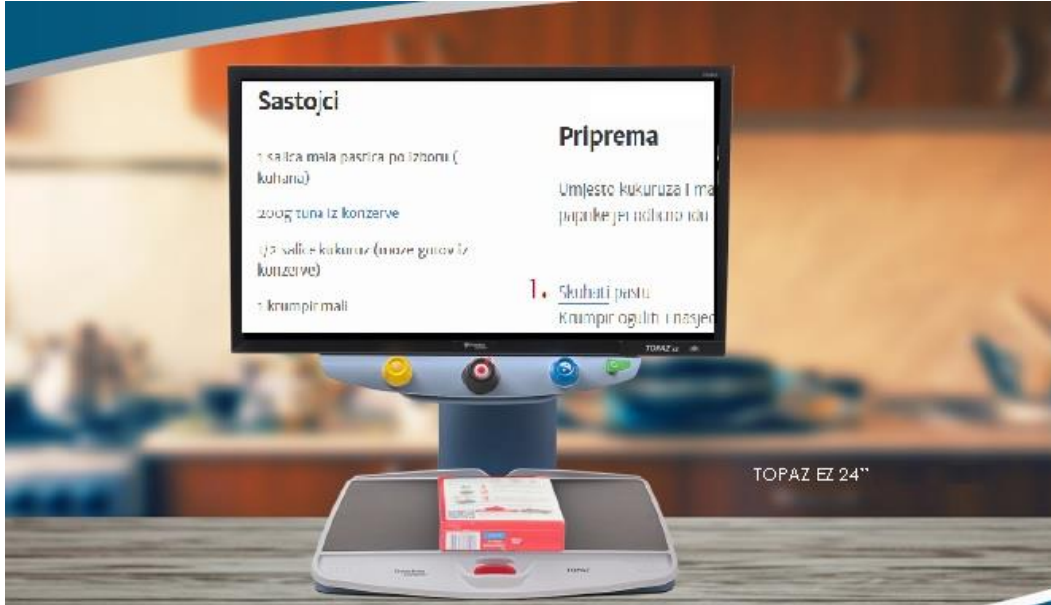
Slika 7. Stolno elektronsko povećalo

Bitno je spomenuti i prijenosna elektronska povećala. Ova povećala se mogu koristiti i kao statična povećala, ili ipak pod određenim kutom. Jedinstvena ergonomska ručka se može postaviti u tri različita položaja što daje mogućnost da se povećalo drži u desnoj jednako kao i u lijevoj ruci. Dovoljno veliki ekran pruža mogućnost većeg vidnog polja, nego kod ostalih povećala i veoma dobru kvalitetu slike. Ukoliko je jednostavno centralno postavimo, pomaže u određivanju položaja čitanja. Sve funkcijske tipke su locirane uz ručku, uključujući i freeze tipku za zamrzavanje slike (Teskeredžić i sur., 2013).