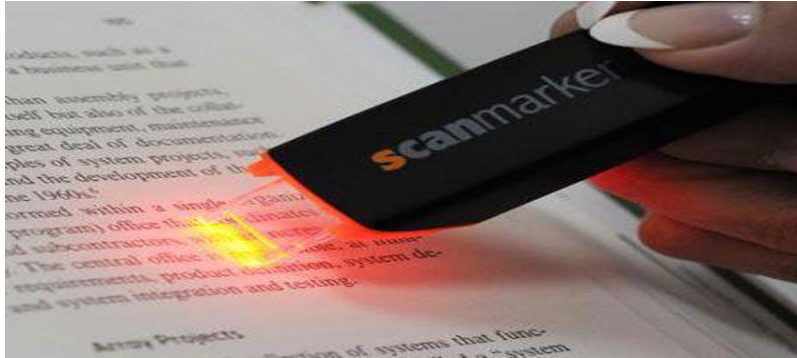
Slika 11. Olovka za čitanje ili scanmarker