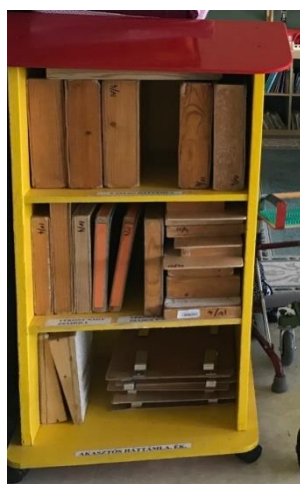
Slika 3 Drveni blokovi (stepenice) različitih visina te dolje desno drveni učvršćivači papira