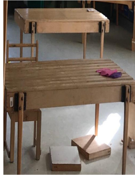
Slika 6 Drveni rešetkasti ležajevi, „plinths“