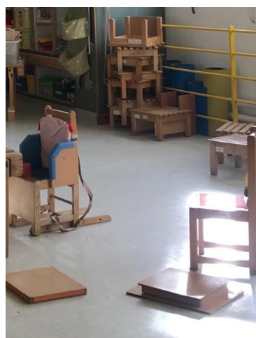
Slika 4 Stolice različitih stupnjeva potpore te drveni blokovi (stepenice)