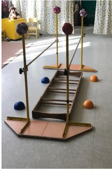
Slika 5 Horizontalne drvene ljestve te ograda korišteni u programu hodanja