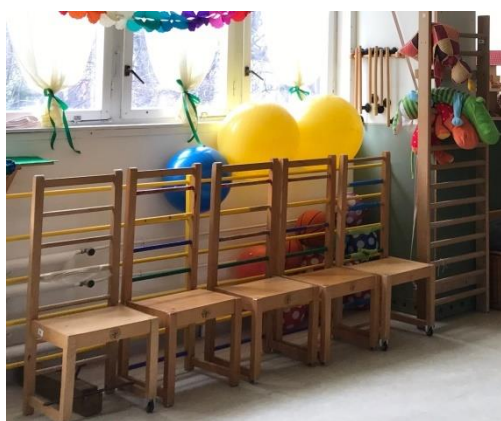
Slika 1 Drvene stolice s visokim rešetkastim naslonima i kotačima te uspravne drvene ljestve

Faktori pri odabiru odgovarajućih pomagala su: asistiranje pokretu, a ne njegovo zamjenjivanje; visina koja omogućava sigurnost, ali onemogućava oslanjanje težine; mogućnost postupnog povlačenja ili smanjenja učestalosti korištenja prilikom usvajanja vještine i napredovanja učenjate omogućavanje učenja koje dovodi do smanjenja ili rješavanja problema. Pomagala korištena u KE trebaju biti što jednostavnija kako bi se povećala mogućnost njihovog korištenja i izvan konteksta podučavanja te generaliziranja stečenih znanja u svakodnevnim situacijama. Značajni su facilitatori, pomagač korisniku s motoričkim teškoćama, no važno je da ih ne shvaćamo kao jedinu metodu prevladavanja teškoće (Brown i Mikula-Tóth, 1997).