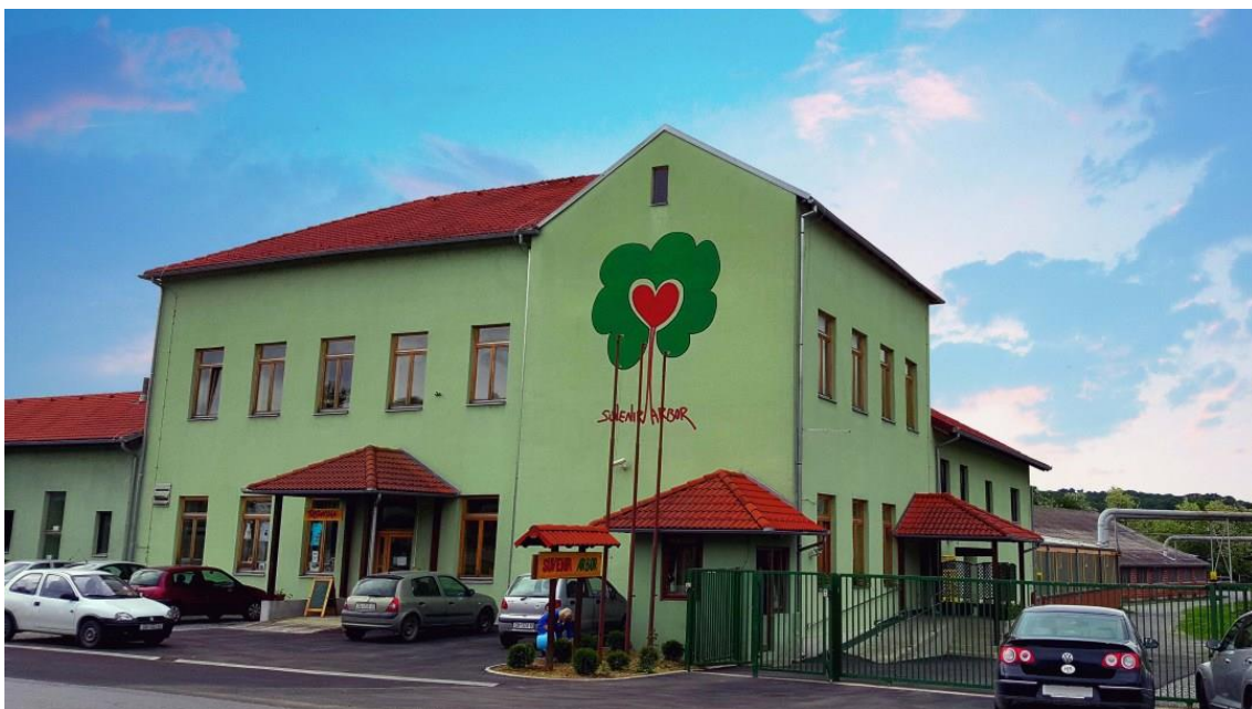
Slika 3: Zaštitna radionica „Suvenir Arbor Sirač“