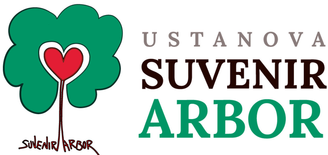
Slika 4: Logo zaštitne radionice „Suvenir Arbor Sirač“

Primarna djelatnost ove ustanove je proizvodnja proizvoda od drva, točnije drvenog namještaja i to od punog drva. Uz to, Ustanova se bavi i proizvodnjom tekstilnih i platnenih proizvoda poput majica s tiskom, platnenih vrećica s raznim motivima, drvenih dječjih igrački, dječjeg drvenog namještaja. Važno je naglasiti kako velik broj svojih proizvoda, posebice drvenog namještaja, ova zaštitna radionica plasira na inozemno tržište. Suraduju s klijentima iz Engleske, Nizozemske, Italije. Isto tako je vrlo važno naglasiti kako većina proizvoda sadrži FSC® certifikat što znači da se proizvodi u potpunosti proizvode od drva