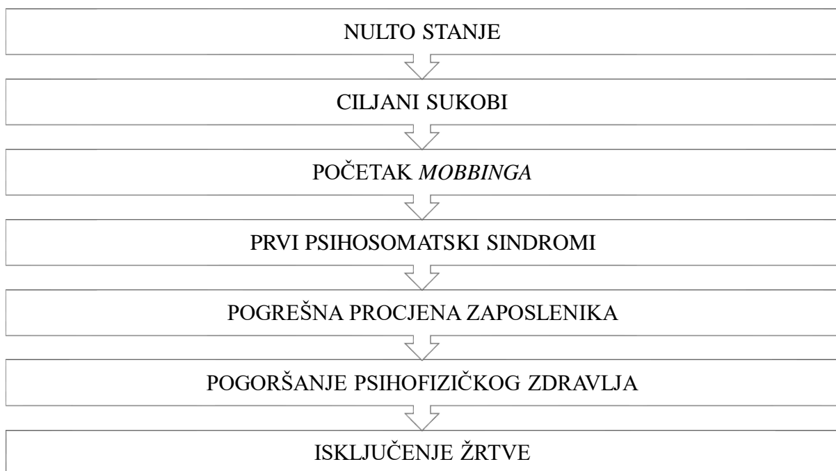
Graf 1. Faze razvoja mobbinga prema Ege (2000, prema Laklija i Janković, 2010; Cornoiu i Gyorgy, 2013)