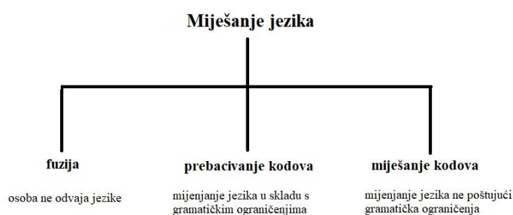
Slika 1. Vrste miješanja jezika prema Meisel (1994)

Nadalje, Miesel (1994) razgraničava prebacivanje kodova od miješanja kodova (engl. code-mixing ). Suprotno definiciji prebacivanja kodova, miješanje narušava gramatička ograničenja ili organizaciju diskursa zbog nemogućnosti osobe da trenutno dohvati traženu riječ u prvom jeziku. Nadređeni pojam njima je language mixing – miješanje obilježja dvaju jezika, unutar rečenice ili kroz više rečenica. Još jedan termin koji se koristi u ovome području je fuzija (engl. fusion ), odnosno miješanje dvaju jezika u situacijama kada osoba nema svijest o odvojenosti dviju gramatika. Iz toga se vidi kako je razlika između fuzije i prebacivanja kodova upravo u toj svijesti o dvama jezicima kao zasebnim entitetima, ali može se reći i kako su prebacivanje i miješanje kodova pitanje izvedbe, dok je fuzija pitanje gramatičke kompetencije.