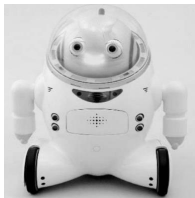
Slika 6. Robot IFBOT (Kato, Ohshiro, Itoh, Kimura, 2004)

Lee i sur. (2012) proveli su istraživanje sa 6 ispitanika s niskofunkcionirajućim PSA – om (od toga 5 dječaka i 1 djevojčica, od 7 do 12 godina, prosječna dob 9.33) te 6 tipičnog razvoja. Korišten je robot Ifbot (Slika 6) koji je visine 45 cm, opremljen kamerom, zvučnikom, mikrofonom s mogućnostima detekcija smjera iz kojeg zvuk dolazi i prepoznavanja glasa, kotačima, očima koje mogu treptati, licem koje se može osvijetliti na razne načine kako bi iskazalo emocije, senzorom za prepoznavanje prepreka i stepenica te senzorom koji prepoznaje rukovanje. Ifbot ima mogućnosti snimanja, pjevanja, plesanja i reprodukcije glasovnih poruka. Ispitivanje se sastojalo od dva verbalna dijela i jednog dijela koji je kombinirao verbalnu i vizualnu interakciju (govor i facijalne izraze), a interakcije su se odvijale s robotom i osobom. Rezultati su pokazali uspješniju interakciju s robotom na aspektima kontakta očima, odgovaranja na verbalne naloge (djeca su bila usmjerenija i odgovarala na verbalne naloge) i facijalnih izraza.