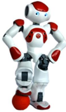
Slika 9. Robot NAO (Anzalone i sur., 2014)

Wainer i sur. (2014) proveli su istraživanje na 6 djece sa PSA – om (od toga 5 dječaka i 1 djevojčica, prosječna dob 6,5). Korišten je minimalno ekspresivni humanoidni robot KASPAR (Slika 10), veličine 60 cm koji posjeduje 14 stupnjeva slobode. Ima mogućnost pokazivanja pojednostavljenih izraza lica naspram pravog ljudskog te može reagirati na dodir djeteta pomičući ruke, glavu i oči. Djeca su sudjelovala u igranju video igrice s odraslom osobom i KASPAR-om. Nije pronađena razlika u igri između prvog i drugog igranja s robotom, ali nakon igranja s robotom, djeca su bila više zainteresirana za igru s osobom nego prije igranja s robotom. Nadalje, iako su djeca doživjela robota zabavnijim od čovjeka, njihove vještine rješavanja problema bile su bolje s osobom. Wainer i sur. (2014) procijenili su trijadičku komunikaciju i kolaborativnu igru 6 djece sa PSA – om (od toga 5 dječaka i 1 djevojčica, prosječna dob 7,28) u interakciji s Kasparom koji djeluje samostalno i koristi informacije o trenutnom stanju igre imitacije kako bi djecu uključio u igru, motivirao i ohrabrio. Djeca su morala naučiti kako komunicirati i stupiti u interakciju s drugom djecom te izmjenjivati uloge. Pokazalo se kako su djeca bolje surađivala jedna s drugima nakon igre s Kasparom te su međusobno ostvarivala češći i duži kontakt očima.