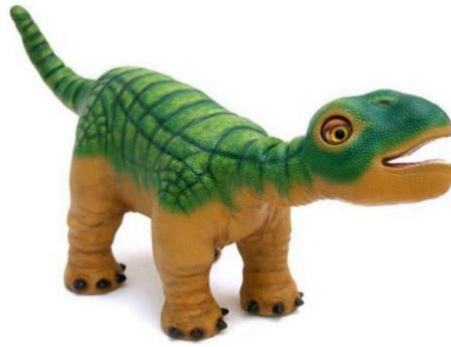
Slika 5. Robot Pleo (Kim i sur., 2012)

Lee i sur. (2012) proveli su istraživanje sa 6 ispitanika s niskofunkcionirajućim PSA – om (od toga 5 dječaka i 1 djevojčica, od 7 do 12 godina, prosječna dob 9.33) te 6 tipičnog razvoja. Korišten je robot Ifbot (Slika 6) koji je visine 45 cm, opremljen kamerom, zvučnikom, mikrofonom s mogućnostima detekcija smjera iz kojeg zvuk dolazi i prepoznavanja glasa, kotačima, očima koje mogu treptati, licem koje se može osvijetliti na razne načine kako bi iskazalo emocije, senzorom za prepoznavanje prepreka i stepenica te senzorom koji prepoznaje rukovanje. Ifbot ima mogućnosti snimanja, pjevanja, plesanja i reprodukcije glasovnih poruka. Ispitivanje se sastojalo od dva verbalna dijela i jednog dijela koji je kombinirao verbalnu i vizualnu interakciju (govor i facijalne izraze), a interakcije su se odvijale s robotom i osobom. Rezultati su pokazali uspješniju interakciju s robotom na aspektima kontakta očima, odgovaranja na verbalne naloge (djeca su bila usmjerenija i odgovarala na verbalne naloge) i facijalnih izraza.