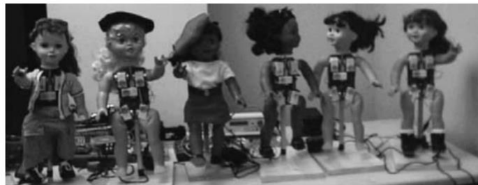
Slika 1. Različiti tipovi robota Robote (Billard, 2003)

određene pokrete (geste rukama i verbalni dijalog) lakše ponovno izvesti u sklopu svakodnevnog života koristeći Robotu (Slika 1). Ovo sugerira kako bi humanoidni roboti ipak mogli biti prikladniji i prirodniји alat u postizanju generalizacije i transfera znanja iz ljudsko – robotske na ljudsku interakciju, ali u konačnici, potreba za ljudskim obilježjima prilikom dizajna ovisi o zadatku. Primjerice, ako je cilj učenja zadatak otvaranja kutije, naglasak je na funkcionalnosti, a ne na izgledu te ruke, no ako je riječ o znakovnom jeziku, potrebno je imati robota s rukama nalik ljudskim koje imaju dovoljan broj stupnjeva slobode kako bi se znakovi mogli izvesti (Billard, 2003). Stupnjevi slobode odnose se na sposobnosti kretanja robota, odnosno na zglobove koji omogućavaju slobodno, nezavisno pokretanje u raznim smjerovima. Što ih više robot ima, to je kretanje lakše i prirodnije. Određeni roboti poput Kaspera na nogama, rukama i prsima imaju taktilne dijelove čija je funkcija učenje prikladne i neprikladne taktilne interakcije s ljudima (Dickerson, Robins i Dautenhahn, 2013). Još neke od karakteristika koje su bitne su: zvučnik u ustima robota kako bi se stvorila iluzija da robot govori (naspram zvučnika koji je negdje drugdje u prostoriji), bežičnost u svrhu povezivanja s računalom kako robot ne bi morao biti spojen žicom (moguća opasnost) te dugo trajanje baterije (Wood i sur., 2019)