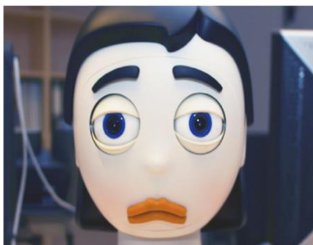
Slika 3. Robot Flobi (Hegel, Eyssel i Wrede, 2010)

Damm i sur. (2013) proveli su istraživanje u kojem je 9 osoba sa PSA – om (prosječna dob 21, prosječan IQ 112.5) te 15 ispitanika kontrolne skupine (prosječna dob 23.40, prosječan IQ 111,65, nema podataka o spolu) u interakciji s robotom i osobom. Zadatak se sastojao od procjenjivanja mentalnih stanja osobe/robotu na temelju pogleda (ispitanik je trebao pratiti pogled prema kartici na stolu). Koristio se robot Flobi (Slika 3) koji je zapravo robotska glava koja nalikuje ljudskom licu zahvaljujući kosi, obrvama i usnama. Posjeduje stereo vid i sluh te ima 18 stupnjeva slobode. Pokazalo se kako je manje kontakta očima ostvareno u ljudskim interakcijama kod ispitanika sa PSA – om, nego u onima s robotom, a kod ispitanika kontrolne skupine nije postojala takva razlika. Nisu izneseni rezultati o postizanju združene pažnje. Također, s prolaskom vremena i približavanju kraja eksperimenta, ovi ispitanici su i u zadatku s robotom sve manje ostvarivali kontakt očima u usporedbi s početkom eksperimenta. Pennisi i sur. (2015) smatraju da je u takvim zadacima robot zapravo distraktor jer poziva dijete na usmjeravanje pažnje na drugi objekt.