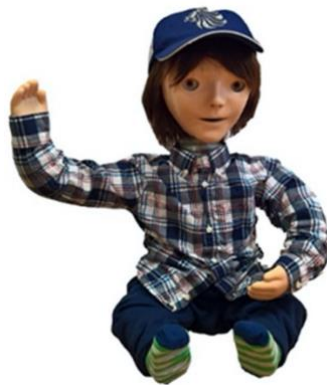
Slika 10. Robot KASPAR (Wood i sur., 2019)

Wainer i sur. (2014) proveli su istraživanje na 6 djece sa PSA – om (od toga 5 dječaka i 1 djevojčica, prosječna dob 6,5). Korišten je minimalno ekspresivni humanoidni robot KASPAR (Slika 10), veličine 60 cm koji posjeduje 14 stupnjeva slobode. Ima mogućnost pokazivanja pojednostavljenih izraza lica naspram pravog ljudskog te može reagirati na dodir djeteta pomičući ruke, glavu i oči. Djeca su sudjelovala u igranju video igrice s odraslom osobom i KASPAR-om. Nije pronađena razlika u igri između prvog i drugog igranja s robotom, ali nakon igranja s robotom, djeca su bila više zainteresirana za igru s osobom nego prije igranja s robotom. Nadalje, iako su djeca doživjela robota zabavnijim od čovjeka, njihove vještine rješavanja problema bile su bolje s osobom. Wainer i sur. (2014) procijenili su trijadičku komunikaciju i kolaborativnu igru 6 djece sa PSA – om (od toga 5 dječaka i 1 djevojčica, prosječna dob 7,28) u interakciji s Kasparom koji djeluje samostalno i koristi informacije o trenutnom stanju igre imitacije kako bi djecu uključio u igru, motivirao i ohrabrio. Djeca su morala naučiti kako komunicirati i stupiti u interakciju s drugom djecom te izmjenjivati uloge. Pokazalo se kako su djeca bolje surađivala jedna s drugima nakon igre s Kasparom te su međusobno ostvarivala češći i duži kontakt očima.