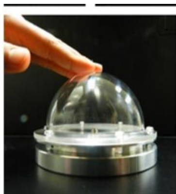
Slika 7. Robot Touch Ball (Lee i Obinata, 2013)

Lee i Obinata (2013) proveli su istraživanje s 4 ispitanika s niskofunkcionirajućim PSA – om u dobi od 9 do 12 godina (prosječna dob 10.25). Korištena su dva robota – Touch Ball (Slika 7) i Parlo (Slika 8). Touch Ball je robot koji je zapravo jedna polovica lopte, veličine 12 cm, koja na temelju pritiska izmjenjenog senzorima, ovisno o jačini pritiska, mijenja boju. Parlo je mali humanoidni robot, veličine 40 cm, koji može plesati, igrati igrice i prepoznavati ljudski glas. Njegova uloga je bila postavljanje i izvođenje zadatka na Touch Ball-u, a pritom je govorio ili mijenjao položaj glave prema sudioniku u svrhu privlačenja pažnje na zadatak. Istraživanje je pokazalo kako je direktna povratna informacija uređaja korisna u uvježbavanju kontrole pritiska te kako bi robot mogao biti korisniji poticaj od ekrana računala ili roditelja. Nadalje, pokazalo se kako je drugi robot dobar u održavanju motivacije i pažnje djeteta.