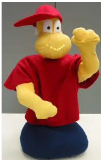
Slika 4. Mobilni robot Tito (Duquette i sur., 2008)

kontakta i fizičke blizine s njim tijekom svih igra imitacije (izrazi lica, pokreti tijela, poznate akcije s ili bez objekata) naspram drugo dvoje djece koji su radili s ispitivačem. Djeca su pokazivala interes približavajući se robotu kada bi se pomicao odnosno iskazivao emocije sreće ili tuge koristeći svjetla i intonaciju glasa. Međutim, imitacija pokreta dijelova tijela i poznatih akcija se nije javljala češće u interakciji s robotom što su autori objasnili teškoćama u razumijevanju namjere na temelju gesti, djelovanja i riječi koje je Tito proizvodio. Nadalje, igri je nedostajalo recipročnosti s obzirom na to da Tito nije imitirao dijete. S druge strane, imitiranje osmijeha se češće pojavljivalo kod djece s robotom, što je objašnjeno lakšim razumijevanjem robotove ekspresije tj. njegovog osvijetljenog osmijeha.