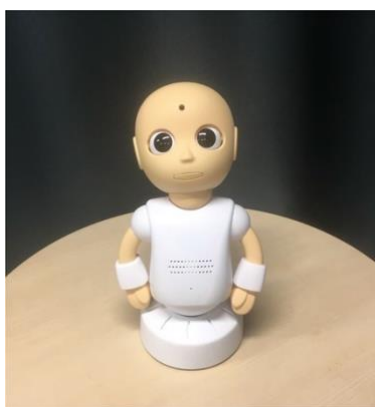
Slika 2. Robot CommU (Kumazaki i sur., 2008)

Kumazaki i sur. (2018) su u istraživanju koristili dva humanoidna robota CommU (Slika 2) koji su se držali unaprijed pripremljenog dijaloga na temu zadatka rođendanske procjene iz ADOS-a bez obzira na djetetove reakcije. Svi ispitanici su bili motivirani tijekom cijelog trajanja procjene s robotom, a primijećeno je kako jedan sudionik sa PSA – om zbog neugode nije mogao dovršiti isti zadatak s kliničarom. Nadalje, pokazalo se kako su se djeca pred robotima ponašala na sličan način kako su se ponašala i u interakciji s kliničarom (uočene su značajne korelacije u sposobnostima socijalne komunikacije) tijekom ovog zadatka te se smatra da bi robotski sustav mogao biti prikladan za procjenu težine simptoma, ali ne i u potvrdi rezultata ADOS-a na temelju usporedbe rezultata s djecom tipičnog razvoja, drugim riječima – nije prikladan za dijagnostiku. Bez obzira na to, autori smatraju kako se ovakvim načinom procjene gdje se koriste dva robota prevladao problem programiranja i prilagođavanja reakcija robota u skladu s reakcijama djeteta.