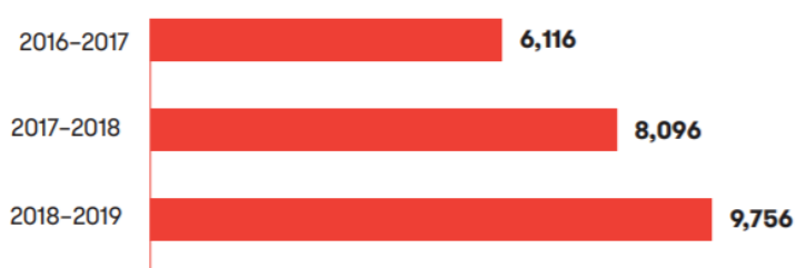
Slika 2: Broj studenata zatvorenika s odobrenim školarinama Pell Grant (Kerr, 2021)

Analizom literature, evidentirano je nekoliko najpoznatijih obrazovnih programa u SAD-u: